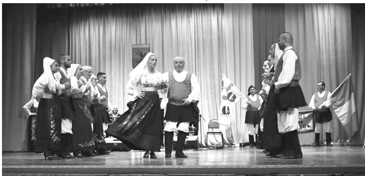
Выступает фольклорный ансамбль из Италии «Figulinas».