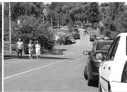
Примеры нарушения Правил дорожного движения в Суздале.

один прекрасный день автостоянка у Музея деревянного зодчества оказалась в частных руках. На стоянке появилось большое здание и узкий въезд. Автобусы туда уже протиснуться не могли и стали стоять на обеих сторонах улицы Пушкинской. Были и иные факторы, из-за которых экскурсионные автобусы перестали заезжать на автостоянки, но они за пределами нашей темы. В последние годы турпоток в Суздаль возрос, и улица Пушкинская превратилась в ад, как для водителей, так и для пешеходов. Автобусы и автомобили плотно друг к другу стали стоять по обеим сторонам улицы, в том числе в крайне опасных местах – на повороте, на крутом спуске. По инициативе ОГИБДД на проезжей части появилась разметка: белая полоса посередине, разделяющая транспортные потоки, жёлтые по краям – запрещающие остановку. Казалось, что порядок начал налаживаться. Но тут очень своеобразно повели себя жители улицы (не установленные пока), замаскировавшие чёрной краской жёлтую полосу на спуске со стороны реки! Дико, но зримо ощущаются замашки самого известного