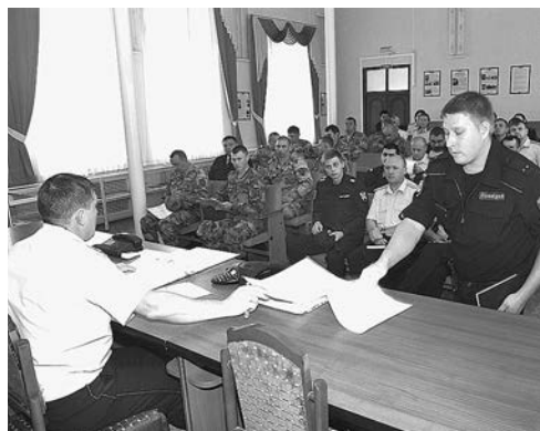
Инструктаж сотрудников полиции в отделе МВД.