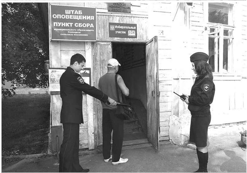
Полицейские следуют к месту работы; несение службы на избирательных участках.