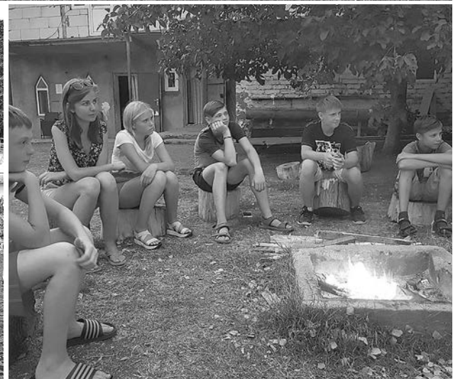
Время, проведенное на сборах, было насыщено интересными событиями.