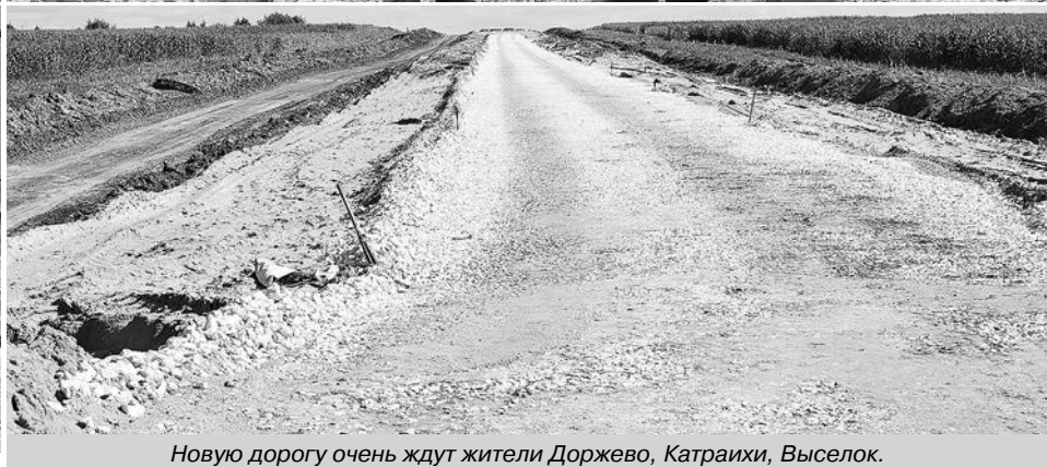
Новую дорогу очень ждут жители Доржево, Катраихи, Выселок.