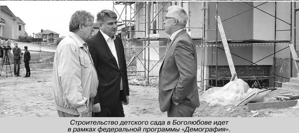
Строительство детского сада в Боголюбове идет в рамках федеральной программы «Демография».