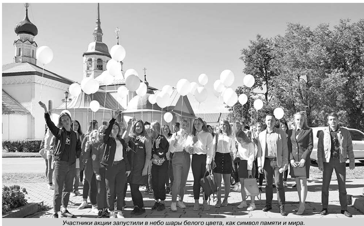
Участники акции запустили в небо шары белого цвета, как символ памяти и мира.