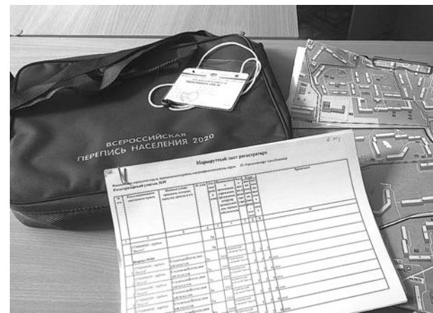
Регистраторы будут оснащены синими портфелями с надписью «Федеральная служба государственной статистики»