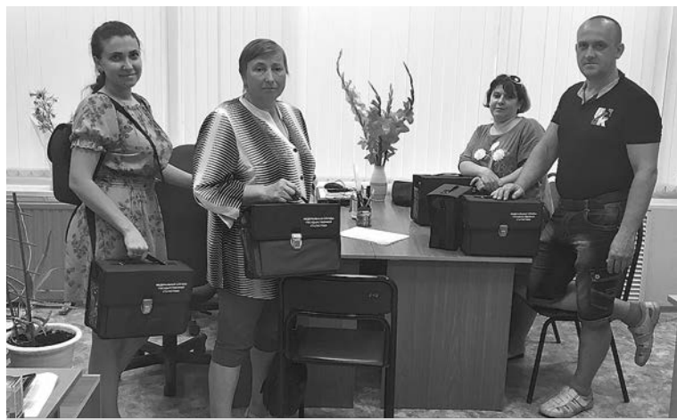
Регистраторов вы можете увидеть на улицах вашего населенного пункта.