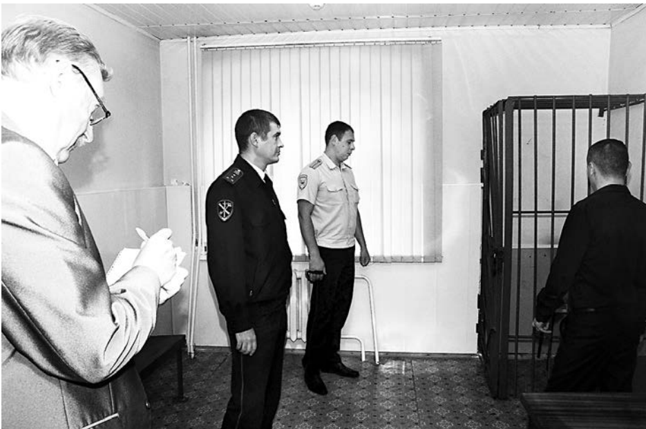
Момент работы комиссии.

Общественный совет при ОМВД России по Суздальскому району.