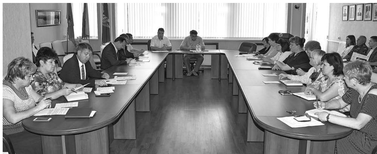
На заседании коллегии администрации Суздальского района.