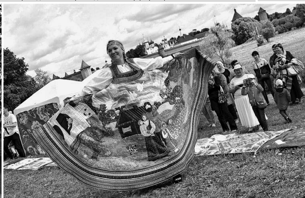
Этот сарафан владимирских мастериц покорила даже Париж.