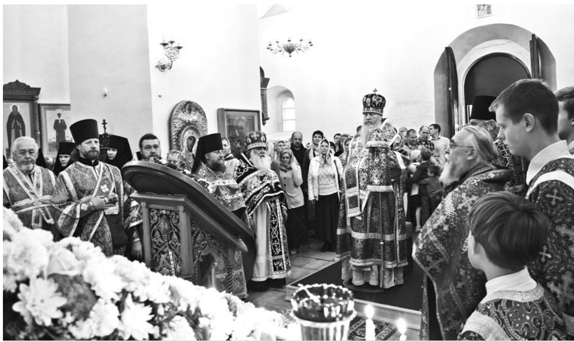
На праздничном богослужении в Покровском соборе.

№ 66 (12023), пятница, 16 августа 2019 г.