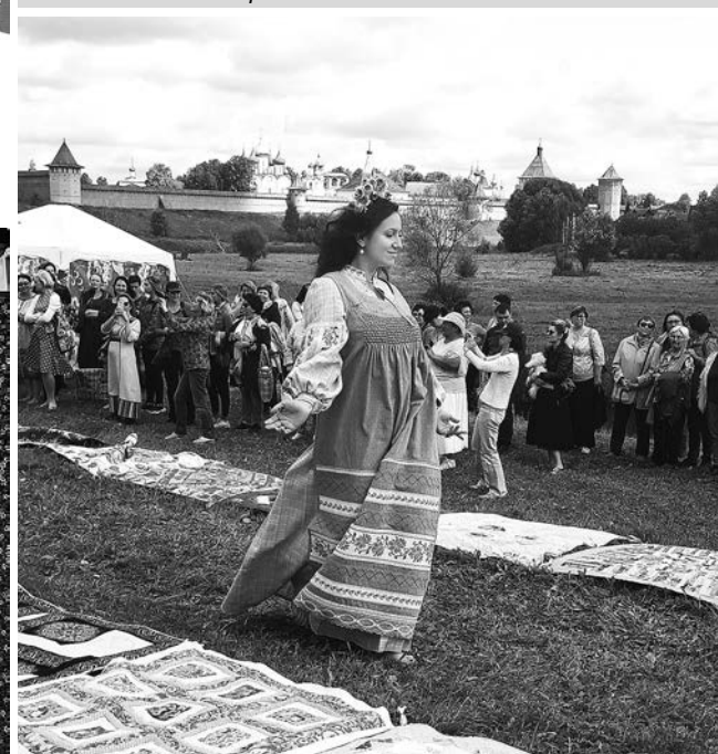
Показ мод в стиле пэчворк в ГТК «Суздаль».