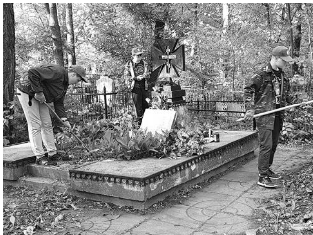
Уборка на Знаменском кладбище.