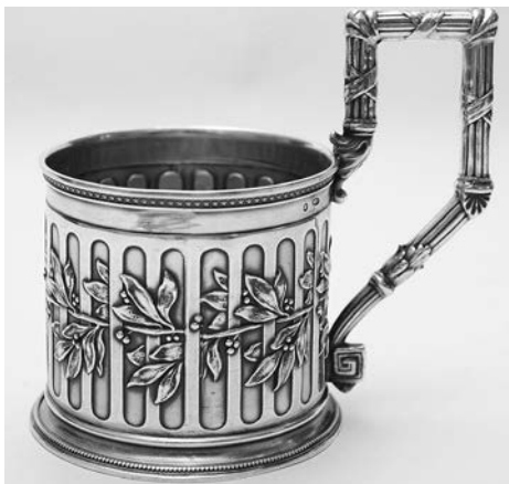
Удобный держатель для стакана с горячим чаем.

Очень часто серебряные подстаканники преподносились в дар, в таких случаях на них гравировалась монограмма или дарственная надпись. Надпись на предмете рубежа XIX-XX