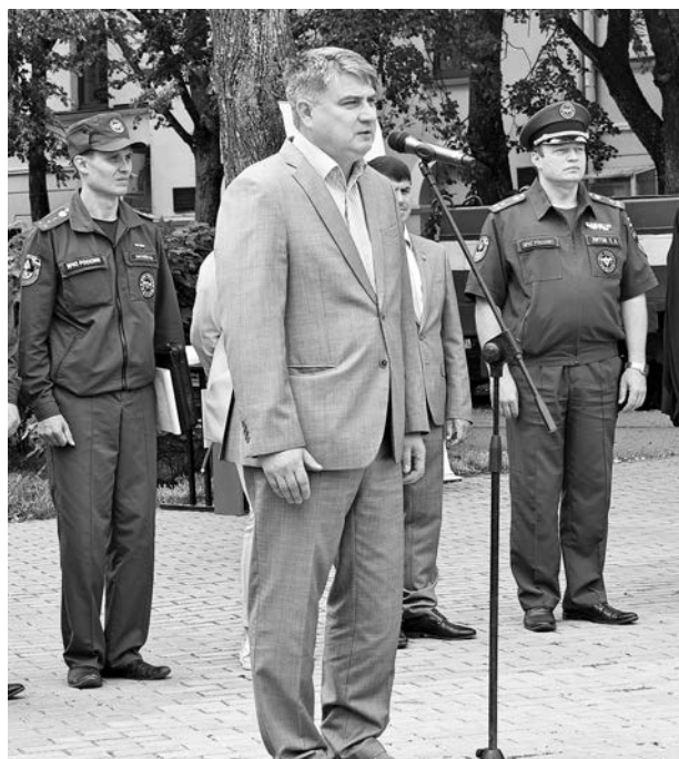
Алексей Сараев, Глава администрации Суздальского района поздравляет личный состав пожарной части.

17 июля в Суздале состоялось торжественное мероприятие, посвященное 155-летию со дня основания общественной пожарной команды города и 370-летию пожарной охраны России.