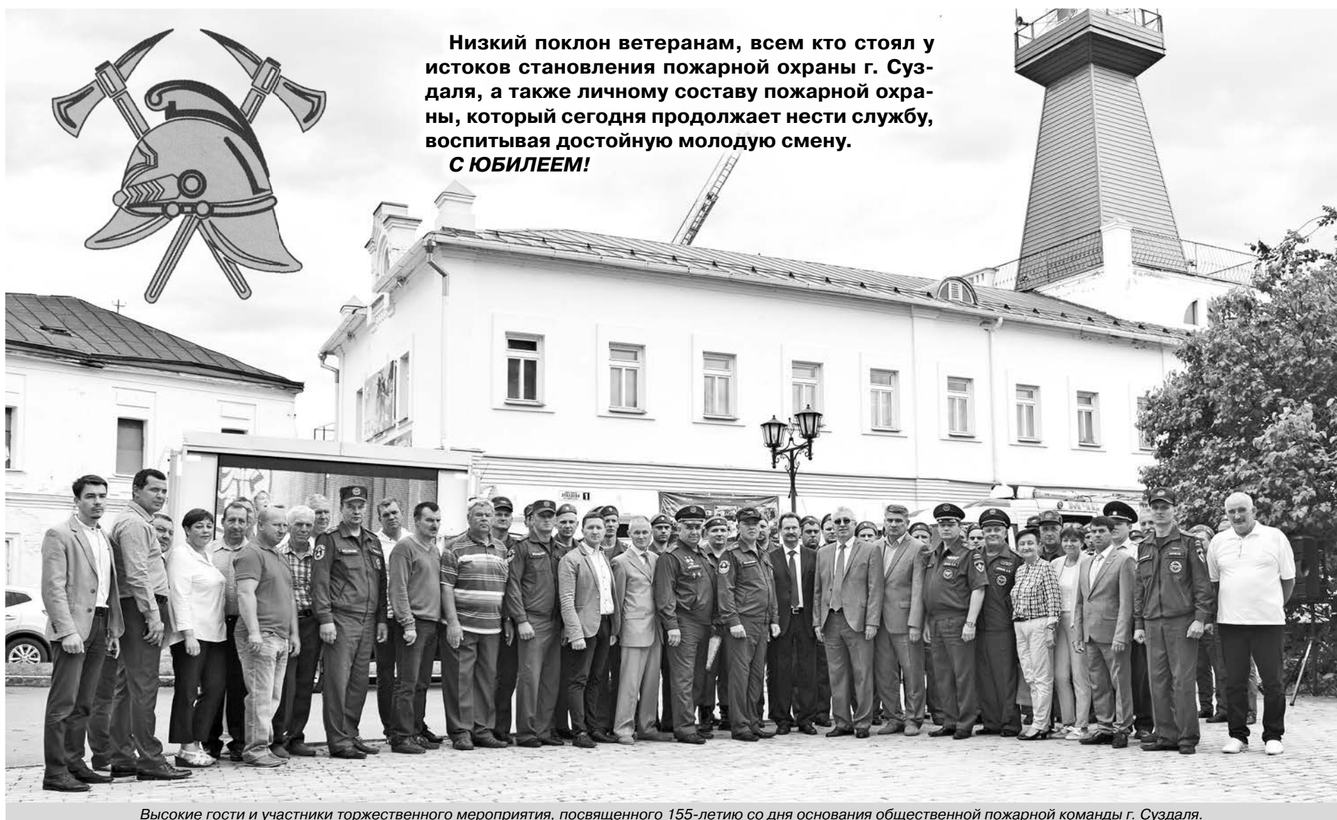
Высокие гости и участники торжественного мероприятия, посвященного 155-летию со дня основания общественной пожарной команды г. Суздаля.