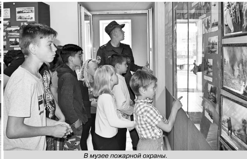
В музее пожарной охраны.