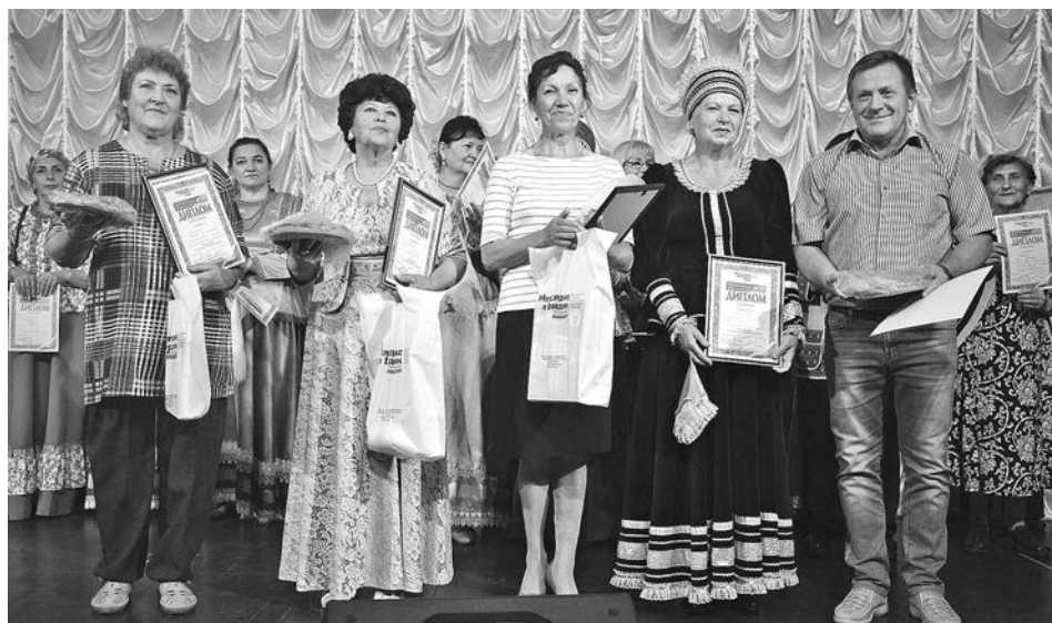
В этом году в оргкомитет конкурса поступило более 250 заявок.

- Первый раз мы заняли в этом замечательном конкурсе третье место, затем