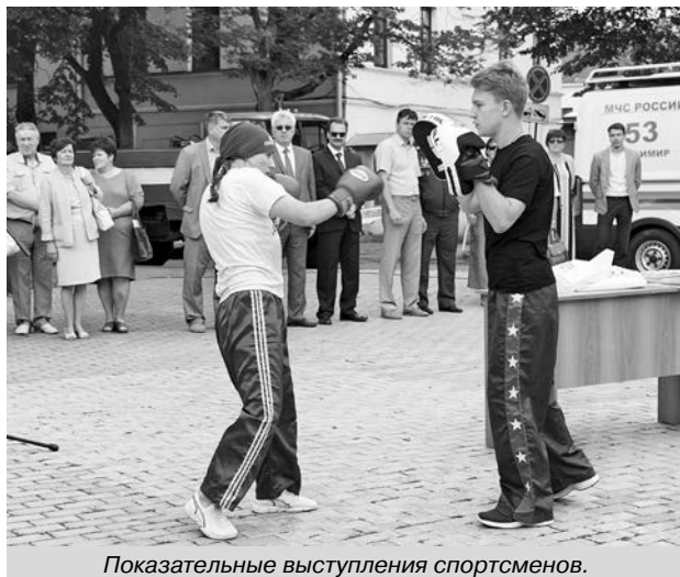
Показательные выступления спортсменов.

С особым пасторским поздравлением и напутствием выступил благочинный Суздаля иеромонах Арсений. Он говорил о том,