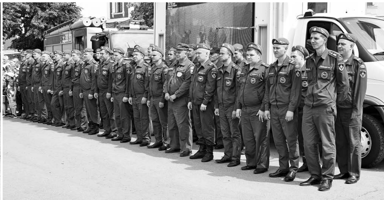
(Подробности о мероприятии читайте на 2 стр.)