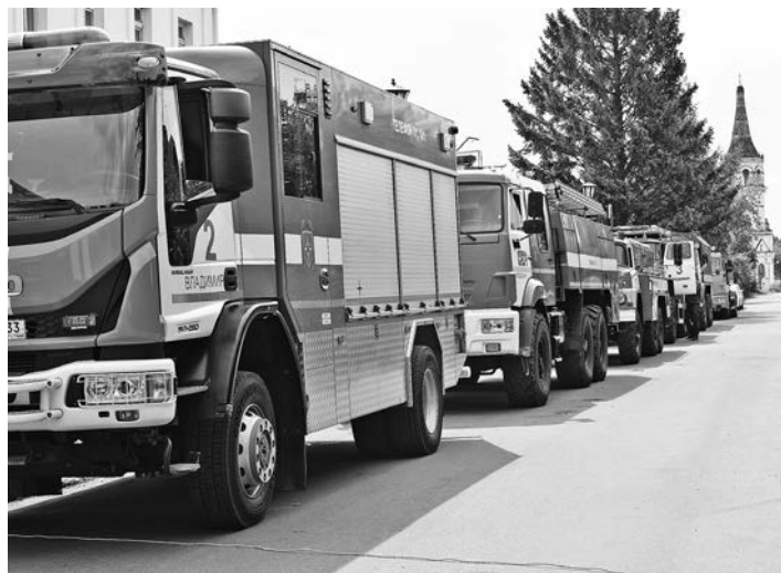
Смотр пожарной техники.