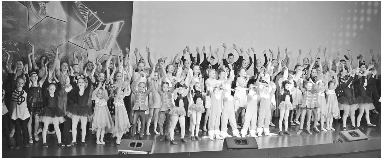
В этом году в оргкомитет областного хореографического конкурса эстрадного танца «Звезды в ладонях» поступило более 100 заявок.

Пресс-служба ВПОО «Милосердие и порядок».