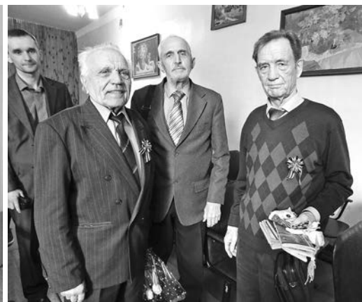
Участники акции «Дети - «детям войны» в Суздале.