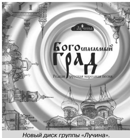
Новый диск группы «Лучина».