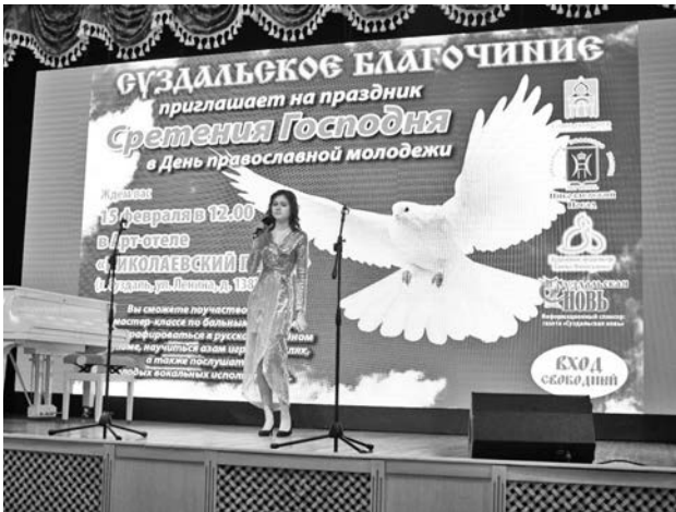
Выступление студии эстрадного вокала «Ариадна».