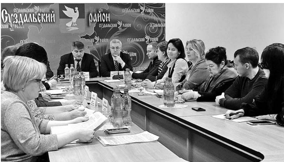
Недавно в администрации Суздальского района прошла встреча с инициативной группой жителей села Сновицы. Состоялся заинтересованный разговор по самым злободневным вопросам, которые они озвучили перед местными властями (на снимке).