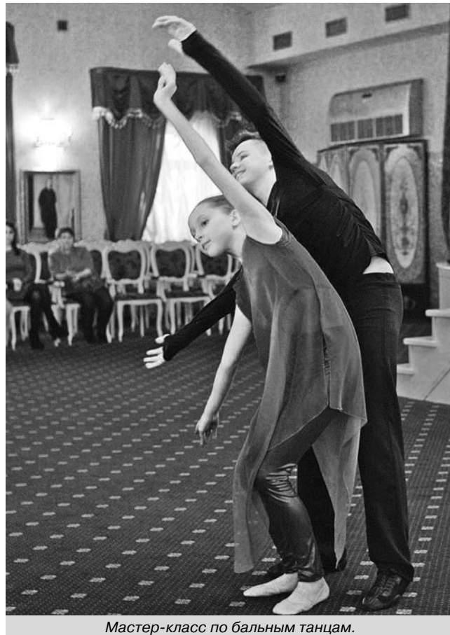
Мастер-класс по бальным танцам.