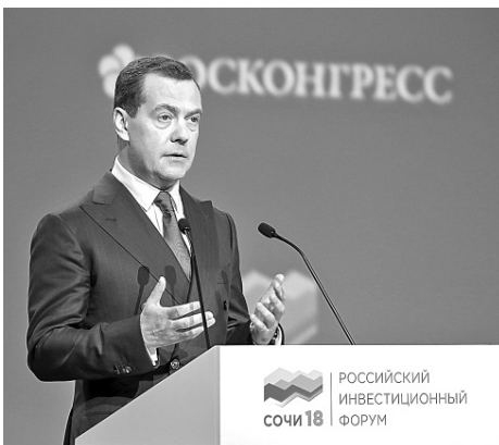
На инвестиционном форуме в Сочи перед его участниками выступает Председатель Правительства РФ Дмитрий Медведев.