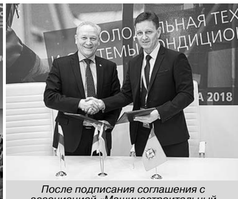
После подписания соглашения с ассоциацией «Машиностроительный кластер Республики Татарстан».