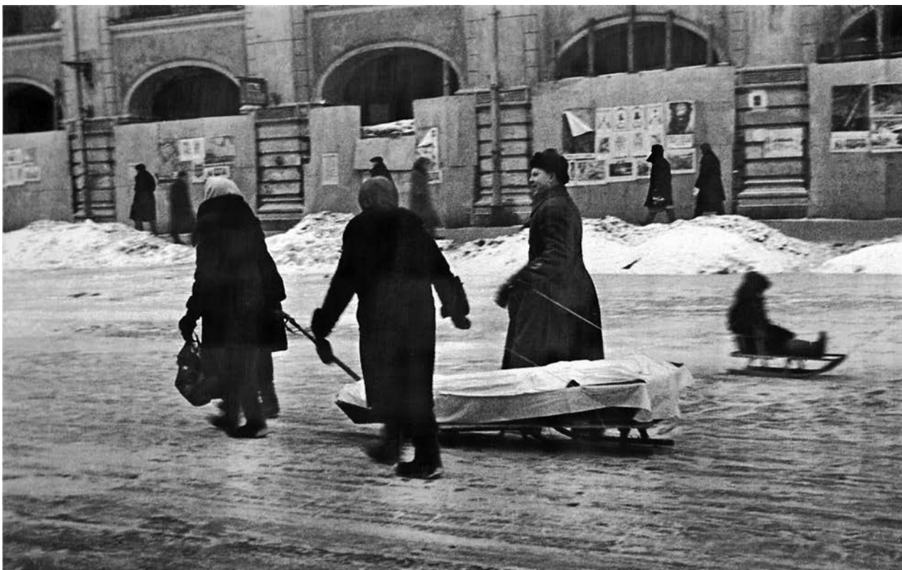
В блокадном Ленинграде, 1942 г. (архивное фото).

27 января отмечается День воинской славы России – День снятия блокады города Ленинграда (1944 год), установленный в соответствии с Федеральным законом от 13 марта 1995 года «О днях воинской славы (победных днях) России».