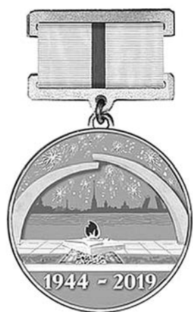
Памятный знак «В честь 75-летия полного освобождения Ленинграда от фашистской блокады».