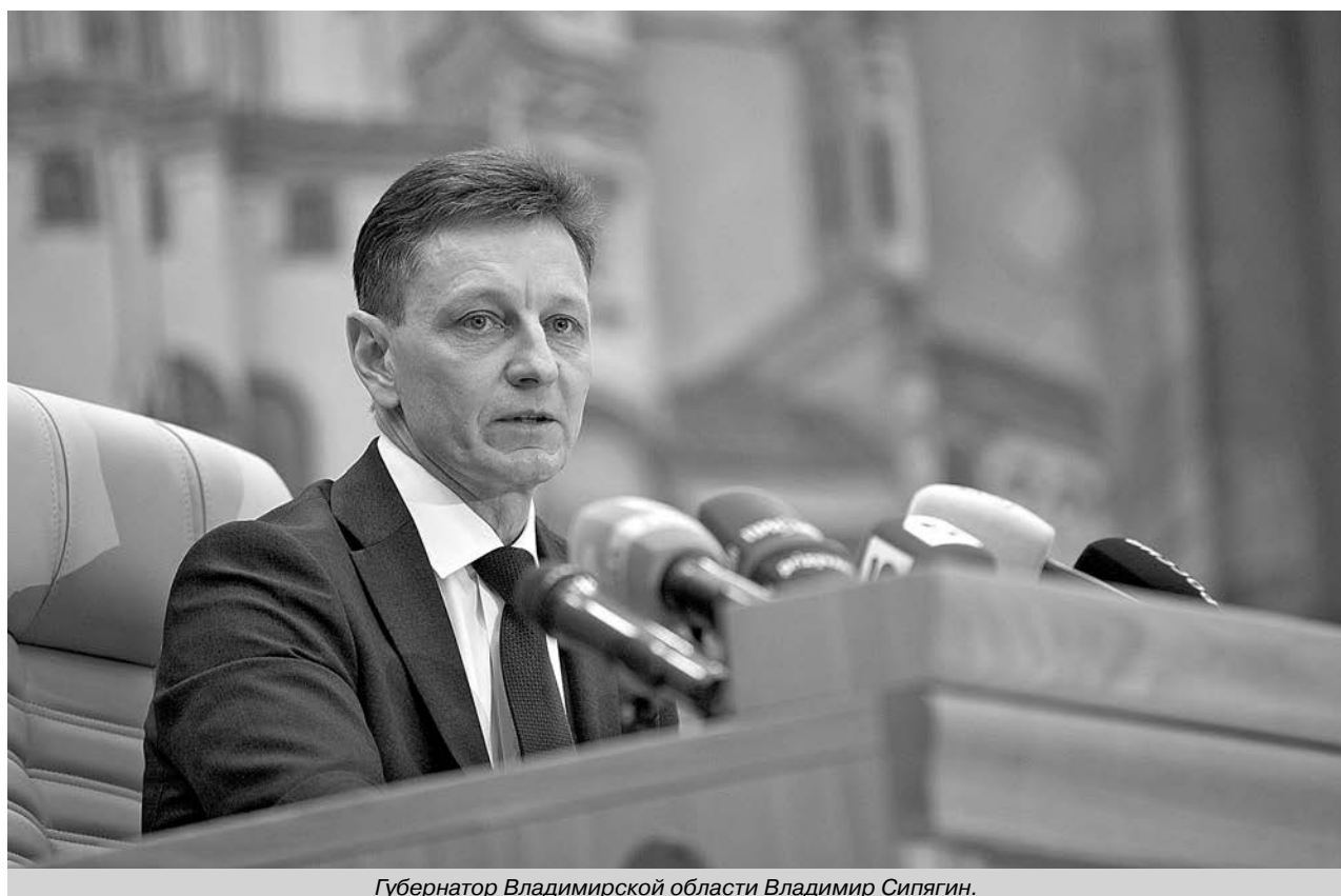
Губернатор Владимирской области Владимир Сипягин.