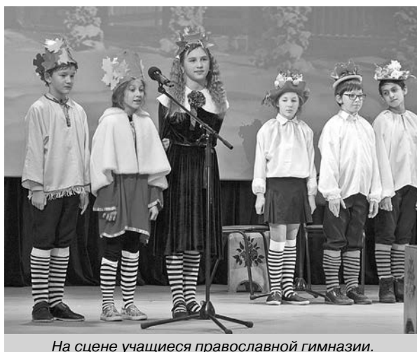
На сцене учащиеся православной гимназии.