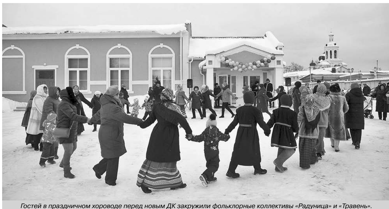
Гостей в праздничном хороводе перед новым ДК закружили фольклорные коллективы «Радуница» и «Травень».