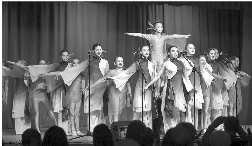
В новом ДК есть зрительный зал и отличная сцена для выступлений.