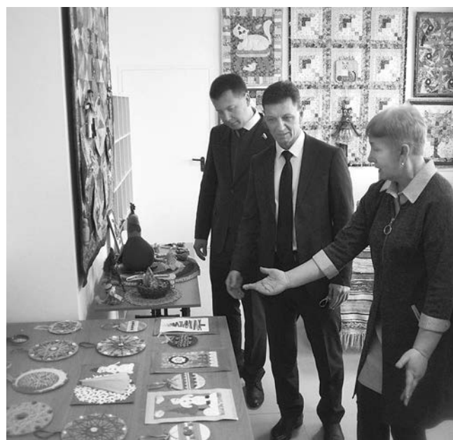
Губернатор В. Сипягин и сенатор А. Пронюшкин осматривают здание нового Дома культуры.