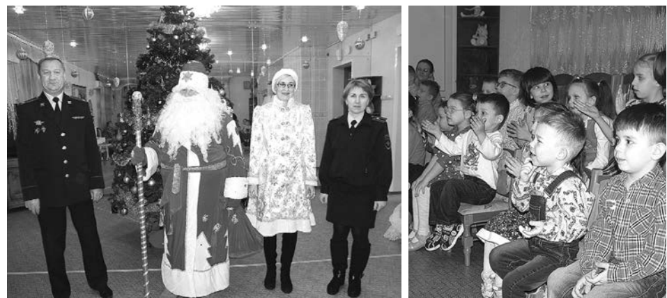
Участники акции «Полицейский Дед Мороз».