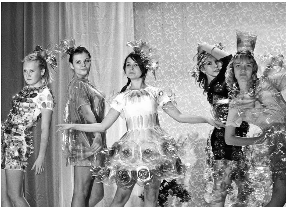
Оригинальные материалы часто используются при изготовлении костюмов в театре моды «Созвездие».