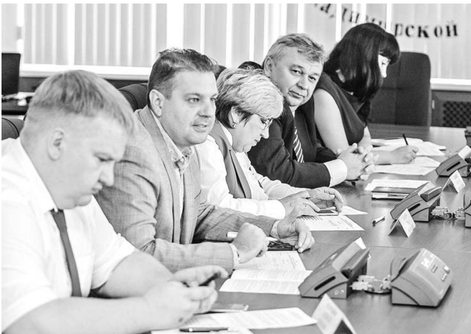
Члены оргкомитета признались: сделать выбор и определить 6 самых достойных, способных эффективнее других работать в Молодежной Думе, было очень непросто.

В Молодежную Думу при Законодательном Собрании завершились довыборы. По разным причинам из ее состава выбыли 6 членов - кто-то сменил место жительства, кто-то не проявил должной активности в работе. В течение августа претенденты подавали заявки в оргкомитет, а 13 и 14 сентября очно защищали свои проекты перед членами оргкомитета.