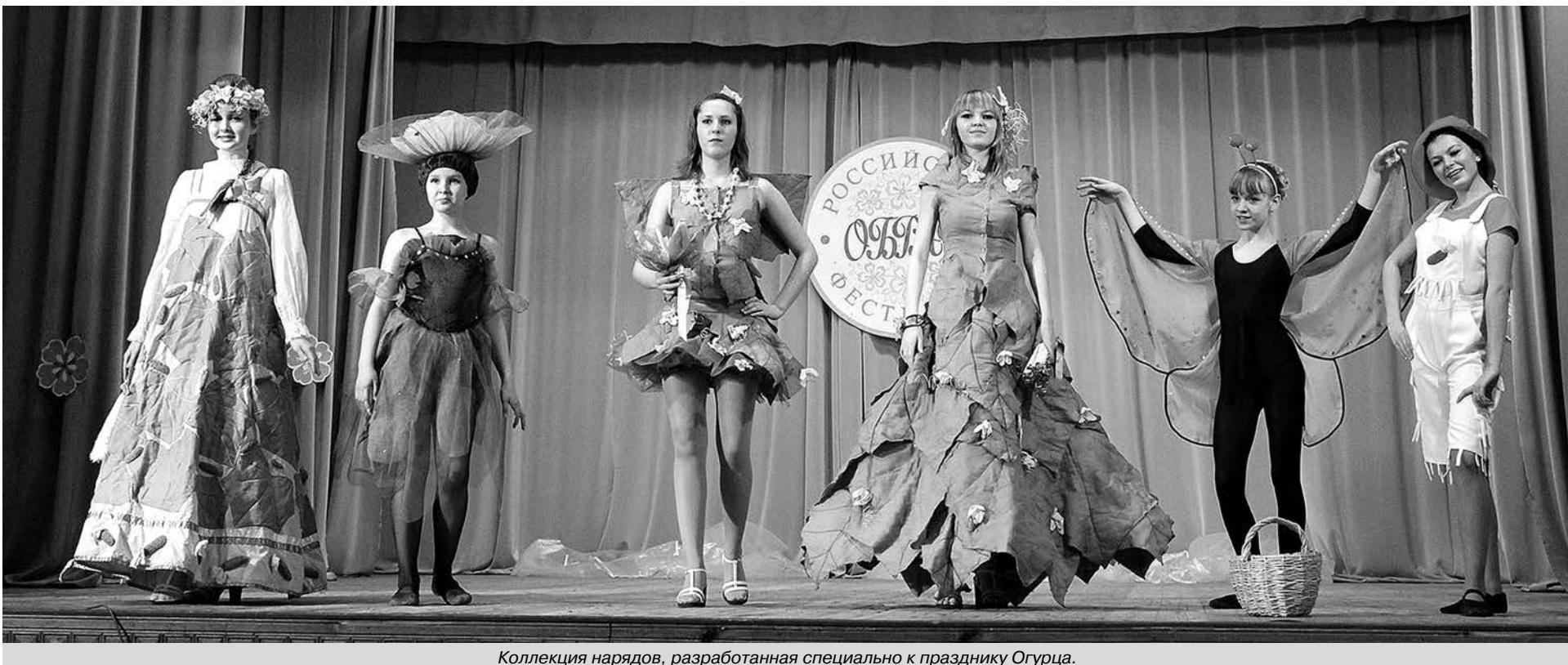
Коллекция нарядов, разработанная специально к празднику Огурца.