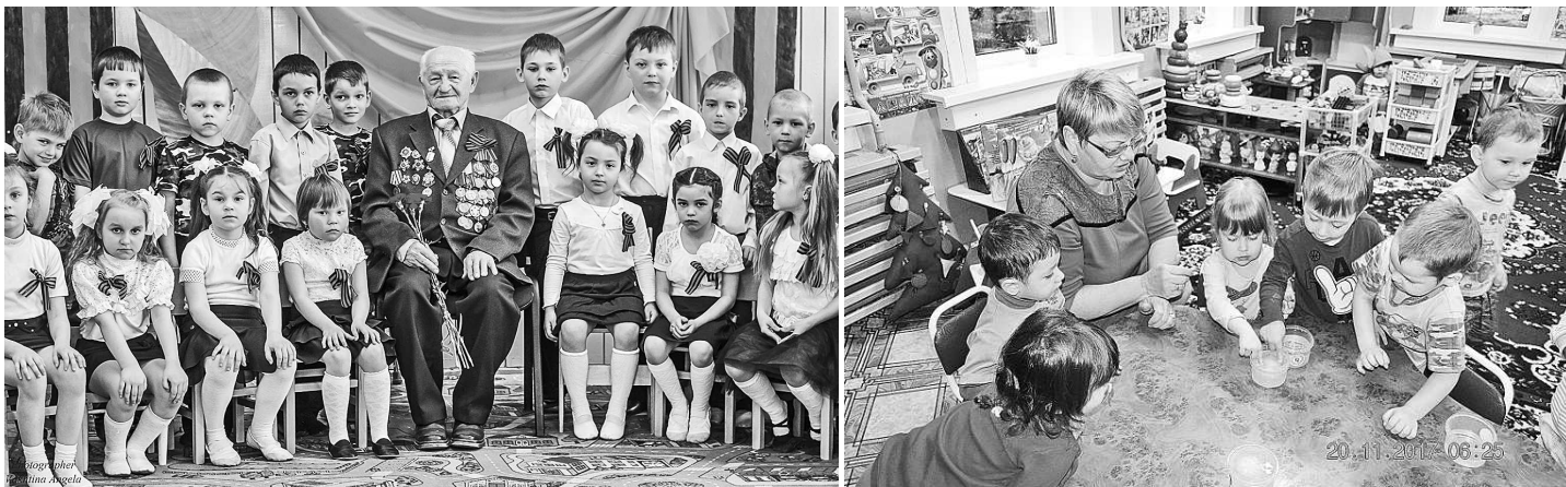
Детей в детском саду «Лучик» окружают заботой и любовью.