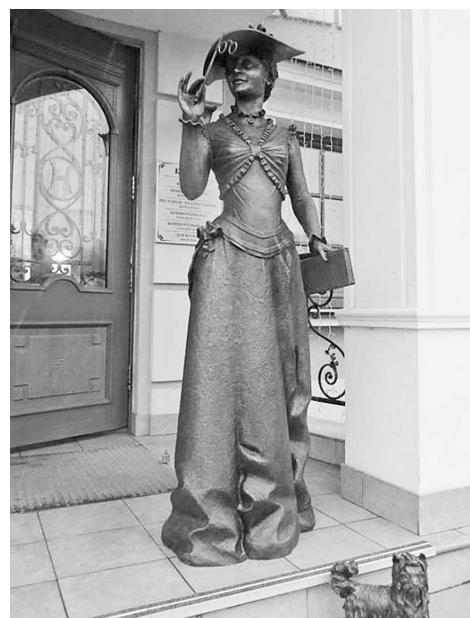
Гостей у входа встречает «Дама с собачкой».

Смело можно утверждать, что «Николаевский Посад» стал главной площадкой культурной и духовной жизни города Суздаля.