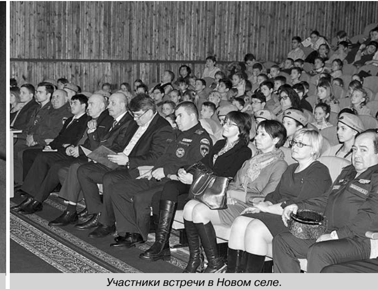
Участники встречи в Новом селе.