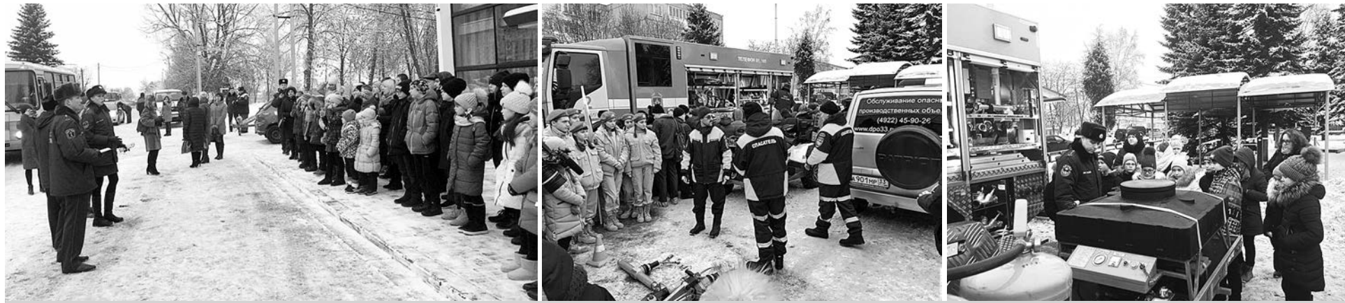
На встречу с сотрудниками МЧС приехали около 200 ребят из 18 школ Суздальского района. Рассказы спасателей вызвали у ребят большой интерес.