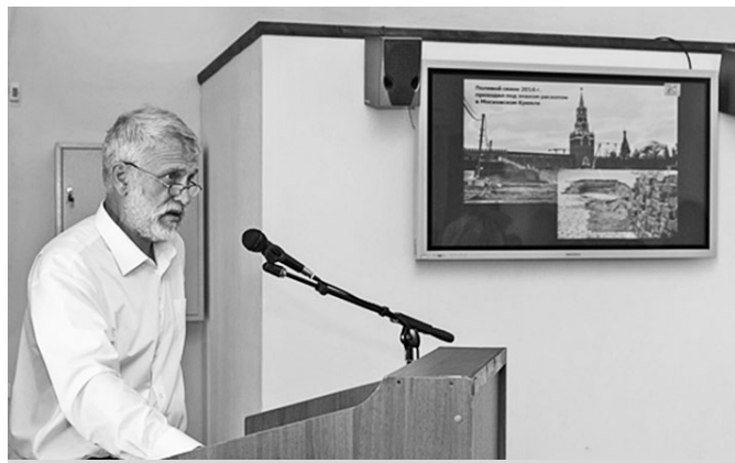
Академик Н.А. Макаров рассказывает об археологических открытиях.