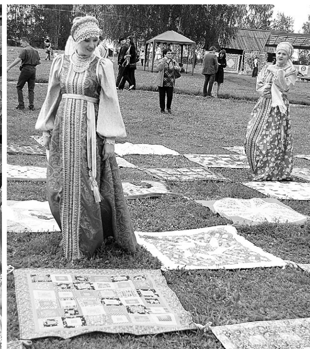
На лоскутном поле.