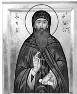
Преподобный Евфимий Суздальский.

• 17 июля отмечалась память нескольких святых, связанных с историей наших земель. Во Владимире, Суздале и Боголюбове поминали благоверного великого князя Андрея Боголюбского (был убит в 1174 году), по сути – первого русского царя, основателя Владимира – древней столицы Руси.