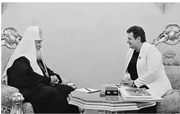
Патриарх Кирилл и Светлана Орлова.

Светлана Орлова проинформировала Патриарха Кирилла о том, какая работа ведётся вблизи церкви Покрова на Нерли: «Там переносятся высоковольтные линии электропередач, чтобы уникальный природный ландшафт не только сохранить, но и представить во всей красе храм и Боголюбский