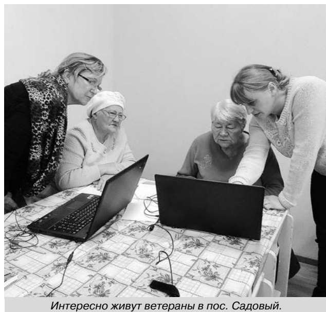
Интересно живут ветераны в пос. Садовый.