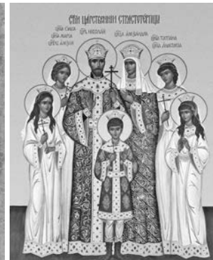
Святые царственные страстотерпцы.

• 17 июля поминали и знаменитого иконописца, преподобного Андрея Рублева (умер в 1428 году). Фильм «Андрей Рублев», снятый режиссером Андреем Тарковским 50 лет назад, считается жемчужиной отечественного кинематографа. 29 июля в Суздале будет торжественно открыт первый в мире памятник этому кинорежиссеру, которому в этом году исполнилось бы 85 лет со дня рождения. Одна из глав знаменитой картины под названием «Колокол» была снята в нашем городе. Этот памятник увековечит и имя святого монаха-иконописца.