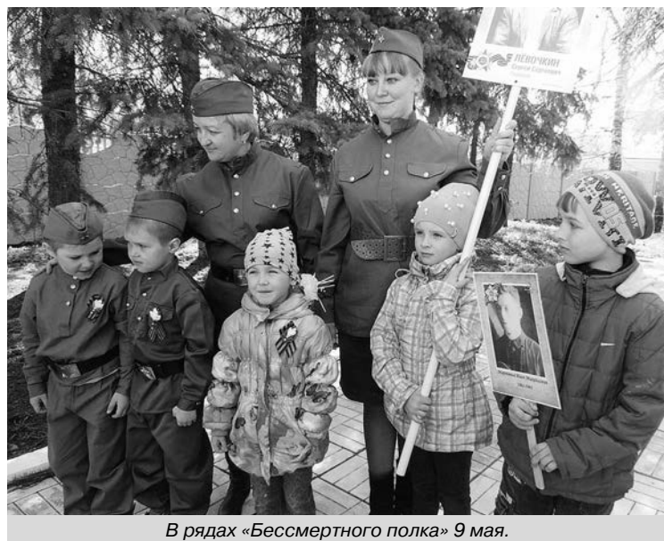
В рядах «Бессмертного полка» 9 мая.