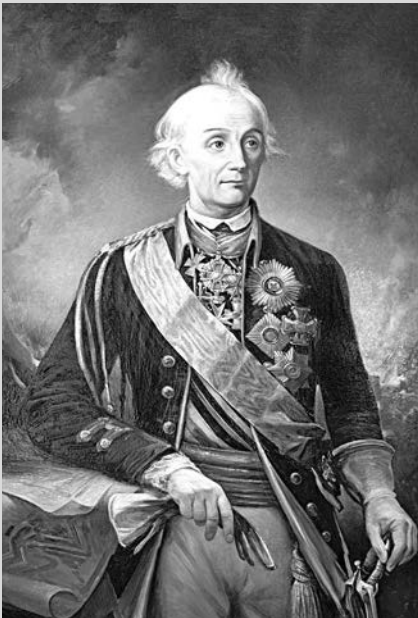
Великий русский полководец Александр Суворов.

- Александр Суворов для меня всегда был значим, первым делом, как военачальник, который всегда побеждал, которого любили солдаты и офицеры, который является автором многих всем известных афоризмов: «Тяжело в учении – легко в бою», «Дисциплина – мать победы» и т.д. При этом я ничего не знал о духовной стороне его личности. Когда шесть лет назад мы начали восстанавливать храм святителя Василия Великого, построенный Александром Суворовым в селе Кистыш в память о своем отце, крестнике Петра Великого, мне потребовалось более детально изучать житие Суворова. И я вдруг понял, что по-настоящему Александра Васильевича не знаю. Стал вникать в службу – и был поражен глубиной и мощью его духа, который, как я понял, и был главным источником его удивительных побед. По мере восстановления храма в Кистыше Суворов постепенно занял главное место в моей жизни. А храм Василия Великого сейчас – важнейшее дело моей жизни. Это мое личное служение как офицера и как православного русского человека тому, чтобы имя Суворова было поднято в нашем обществе на подобающую ему высоту. Это очень масштабная личность, которую по достоинству до сих пор не оценили. Я уверен, что Александр Васильевич будет канонизирован, как святой русский воин, подобно Невскому, Ушакову, Димитрию Донскому. Надеюсь, что в Кистыш в храм Суворовых проложат постоянный экскурсионный маршрут, что в городе