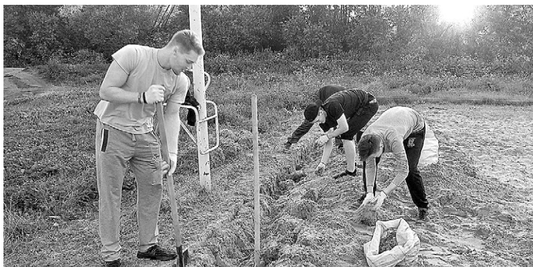
Инициативная группа во время проведения подготовительных работ по благоустройству спортивной площадки.