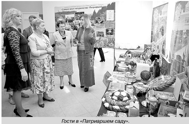
Гости в «Патриаршем саду».