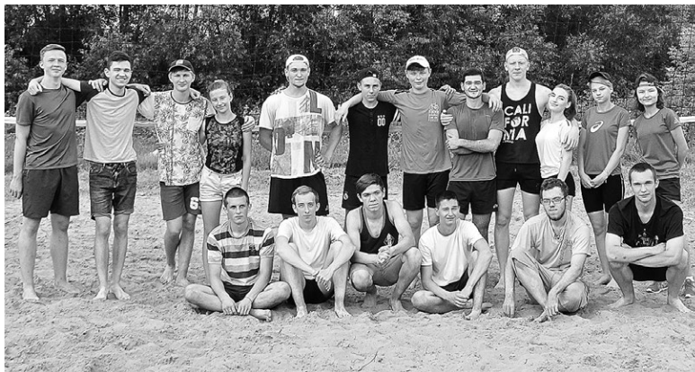
Участники молодежного турнира по пляжному волейболу.

2018 год Указом Президента Российской Федерации объявлен Годом добровольца в России. Отдадно, что наши юные жители активно подключаются к добровольческой работе. Суздальские ребята принимали участие в качестве событийных волонтеров в чемпионате Европы по пахоте, Парламентском форуме «Историко-культурное наследие России», фестивале «Велолето-2018».