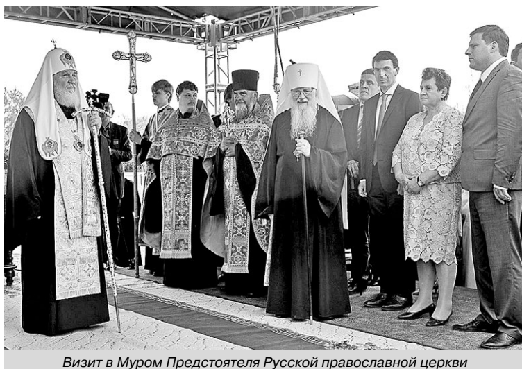
Визит в Муром Предстоятеля Русской православной церкви

Одной из главных региональных наград для семей является Почётный знак администрации Владимирской области «Родительская