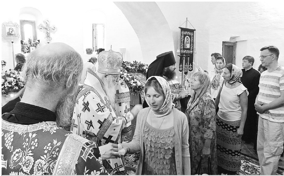
На службе в Успенской церкви. В центре - владыка Евлогий.

17 июля — особенный день для всех православных. Ровно сто лет назад произошло убийство Царской семьи Романовых. Единственный случай в истории, когда погибли и правящие монархи, и все их прямые наследники. По такому случаю в ночь на вторник в Екатеринбурге прошли молебны с участием Патриарха Московского и всея Руси Кирилла и 20-километровый крестный ход, в котором участвовали 100 тысяч верующих.