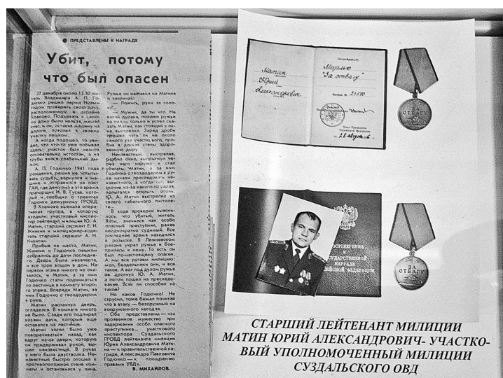
Экспонаты музея, рассказывающие о смелом поступке участкового.

В ходе проверки происшествия выяснилось, что убитый, житель Ялты, значился как особо опасный преступник, ранее неоднократно судимый. Он находился в розыске. Накануне в Лежневском районе Ивановской области украл ружьё и боеприпасы к нему. За проявленное мужество при задержании особо