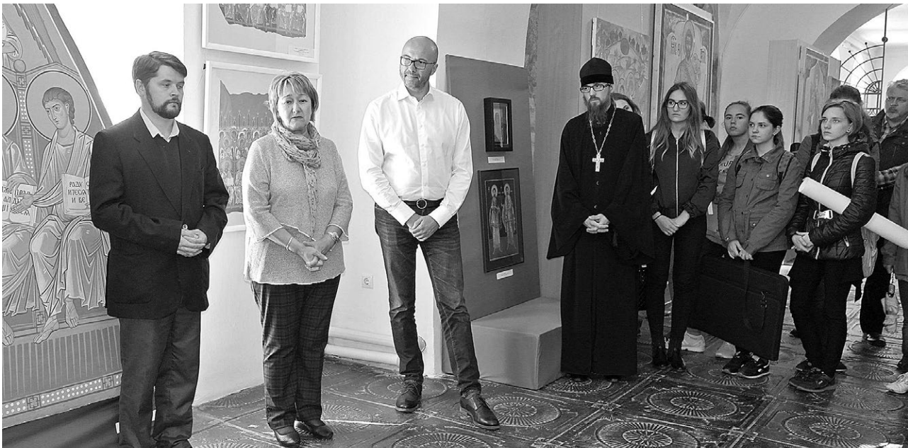
На открытии выставки в Спасо-Евфимиевом монастыре.