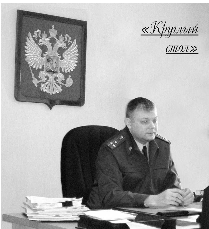
Суздальский межрайонный прокурор Андрей Чернов.