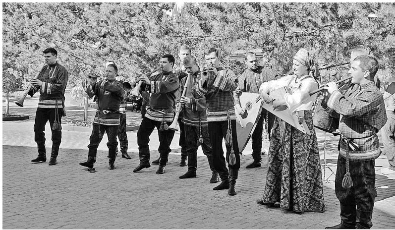
Для участников Конгресса подготовлена большая культурная программа с участием лучших коллективов и музыкантов региона.