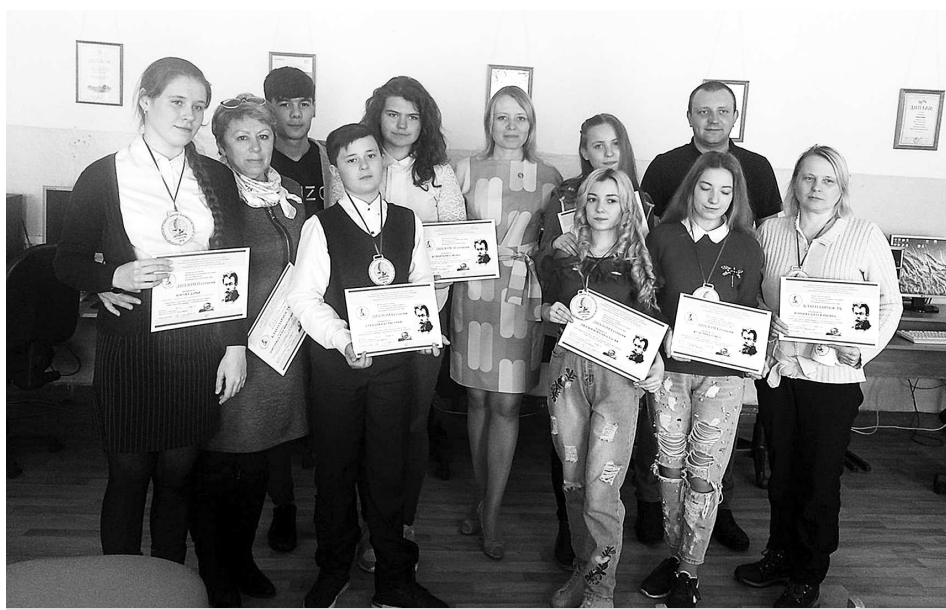
Делегаты от Владимирской области.

В естественнонаучном направлении защищать свою работу на пленарном