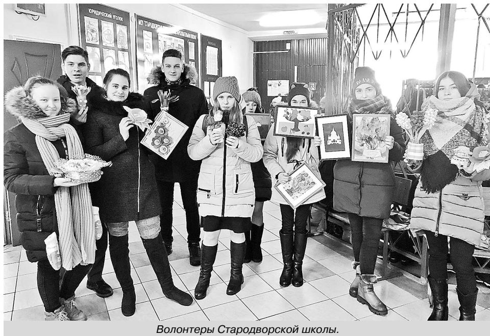
Волонтеры Стародворской школы.