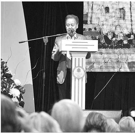
Поэт Андрей Дементьев.