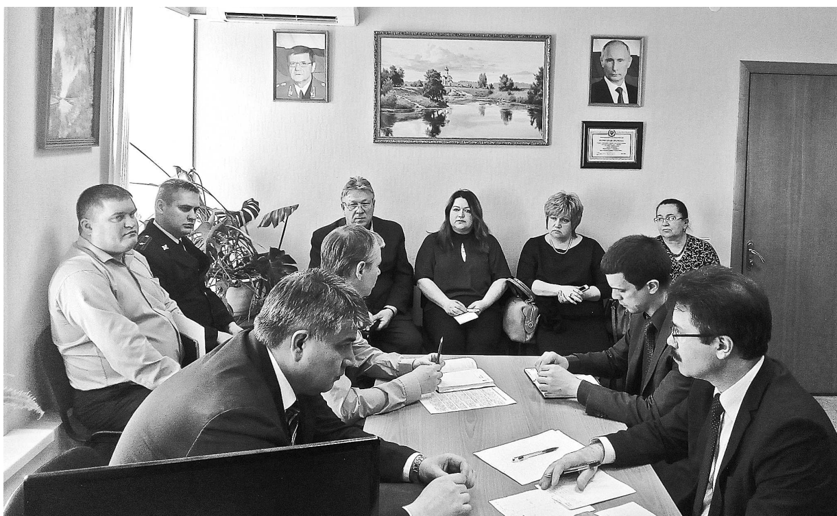
Участники «круглого стола» обсуждают вопросы противодействия коррупции.