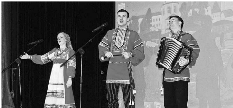
Выступает ансамбль «Золотое яблоко».

Ольга ШУЛЯЕВА, руководитель рекламного отдела ИИЦ «Суздаль-Медиа».