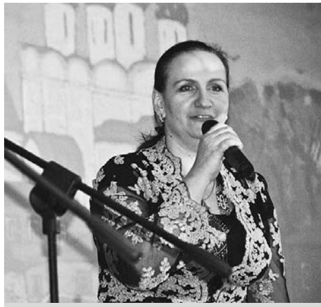
Поет Ия Любченко.