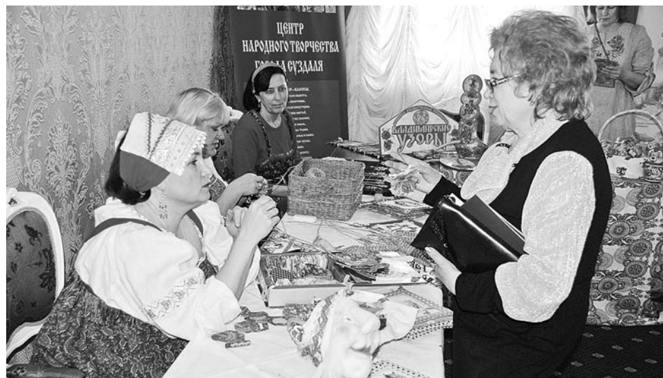
Мастерицы Центра народного творчества г. Суздаля.