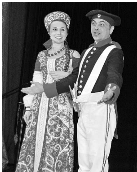
Презентация усадьбы Марьи Искусницы.