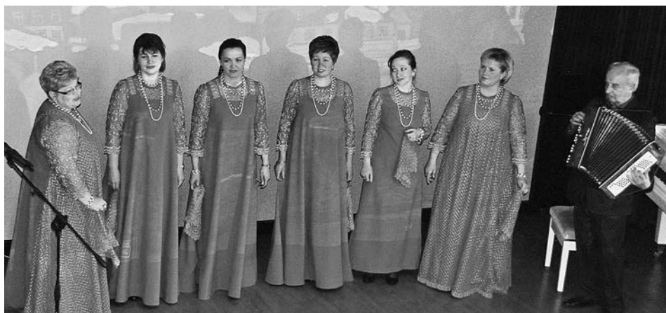
Выступает хор «Бабы лето».