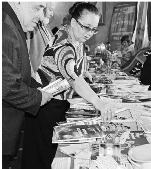
Продукция центра «Суздаль-Медиа».