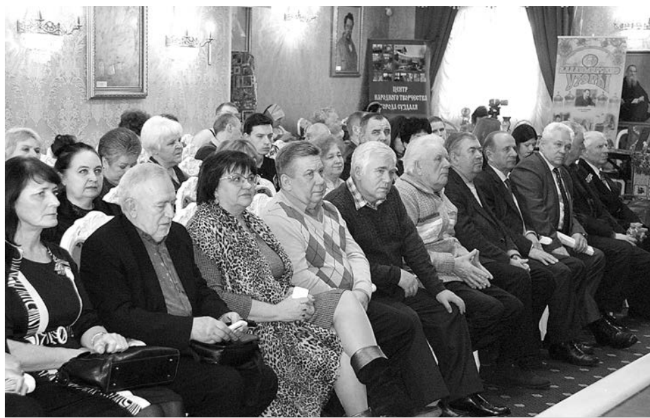
Участники и гости презентации каталога в «Николаевском Посаде».