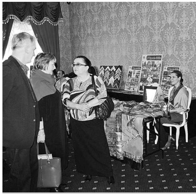
Перед началом презентации каталога.