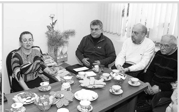
В редакции газеты «Суздальская новь» с немецкими друзьями в 2008 и 2011 годах.