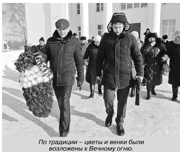
По традиции – цветы и венки были возложены к Вечному огню.