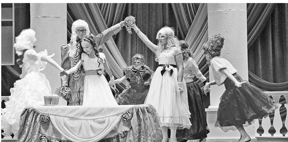
Сцены из спектакля «Золушка».