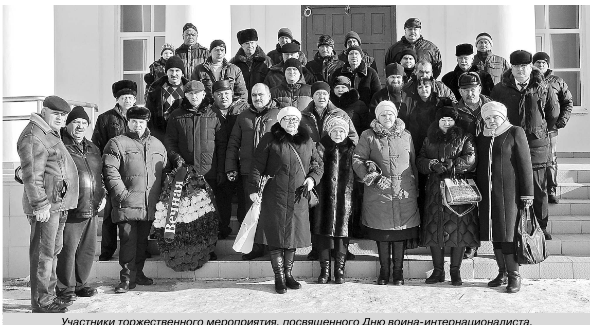
Участники торжественного мероприятия, посвященного Дню воина-интернационалиста.