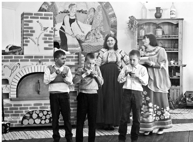
На празднике «Русская печка - всему дому кормилица».