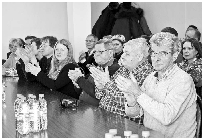
Немецкая делегация на приеме в администрации г.Суздаля.

Как всегда жили члены делегации в семьях суздальцев. Немалый накопленный опыт позволил им практически сразу приступить к выполнению своей основной задачи. Гуманитарная помощь доставлена 73 семьям горожан, среди получивших существенную поддержку семьи с