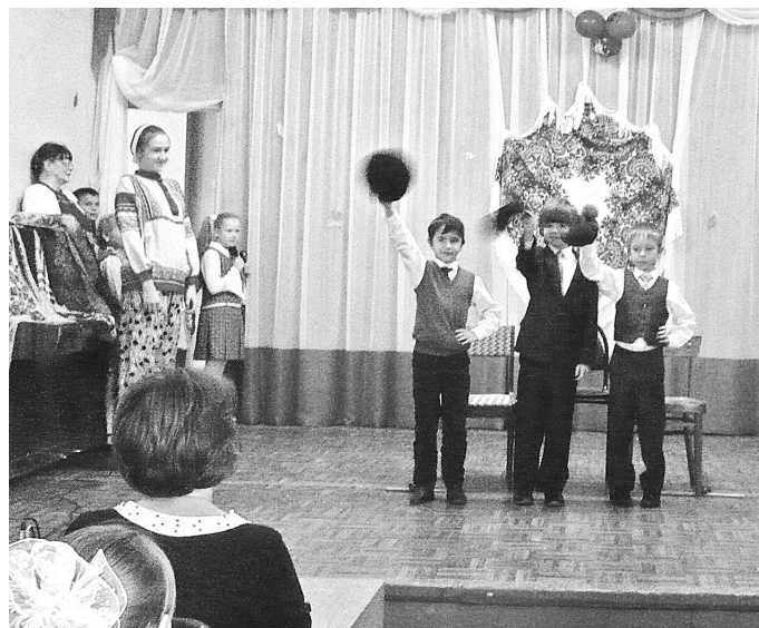
Праздник русской гармошки «В гости к вам пришла гармонь».