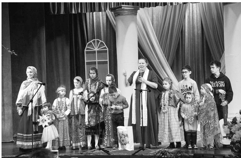
Новогодние и Рождественские встречи стали хорошей традицией в ДК с. Новое.