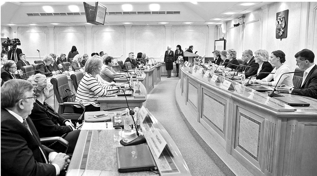
На встрече председателя Совета Федерации В. Матвиенко с членами Координационного совета при Президенте РФ.