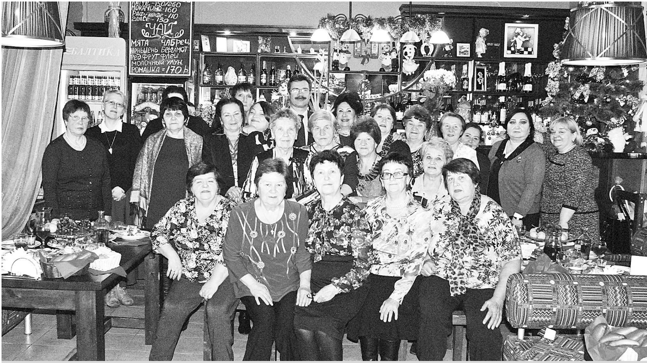
Фотография на память о празднике.