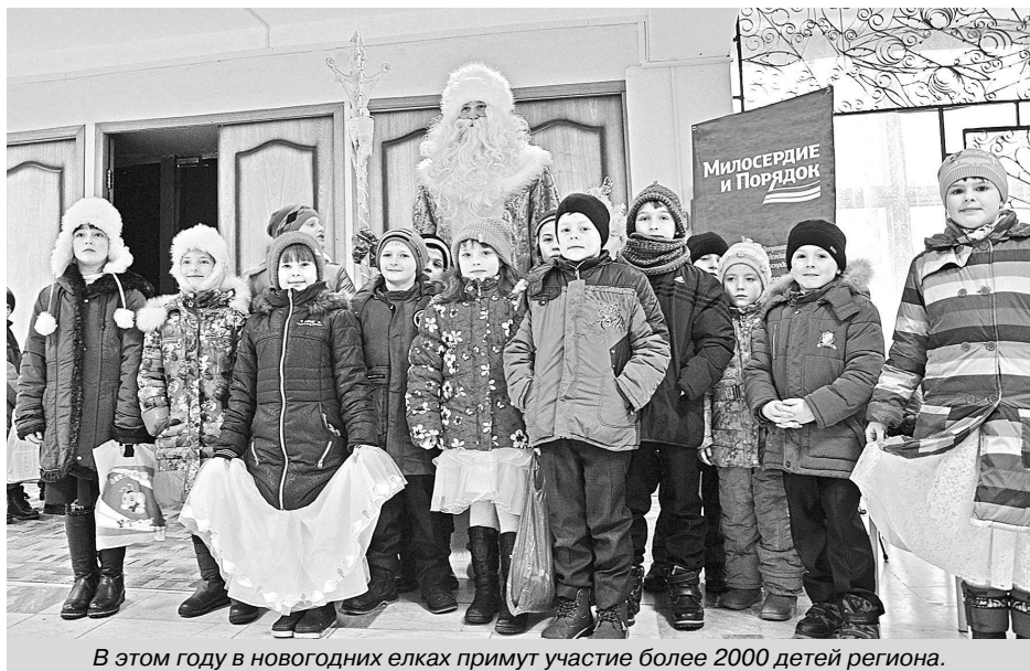
В этом году в новогодних елках примут участие более 2000 детей региона.