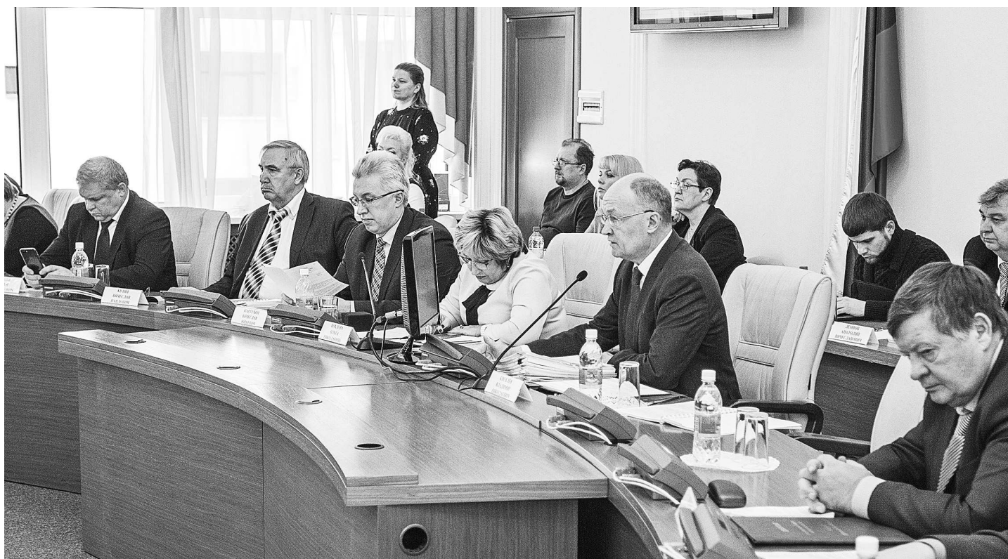
Председатель Законодательного Собрания Владимир Киселёв высоко оценил качество документа, отметив, что бюджет-2018 предусматривает сбалансированное развитие всех отраслей экономики и социальной сферы.

Отдельным пунктом сегодняшней повестки стал доклад первого заместителя Губернатора Лидии Смолиной по ситуации с газификацией Владимирской области. На сегодняшний день - это более 80% по региону, в селе - около 47%. Как правило, негазифицированными остаются небольшие населенные пункты, на 30-50 домов. В настоящее время реализуется сразу три профильные программы - федеральная «Устойчивое развитие сельских территорий», областная и ведомственная, проводимая силами Газпрома. Первый вице-губернатор особо остановилась на вопросе подключения жителей к уже проложенным сетям. Средний уровень подключений - 60%. Провести газ в свой