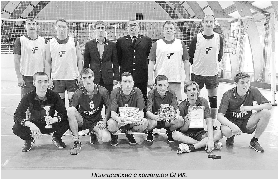
Полицейские с командой СГИК.

ОМВД России по Суздальскому району.