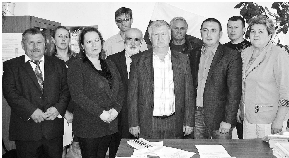
Совет народных депутатов муниципального образования Селецкое.