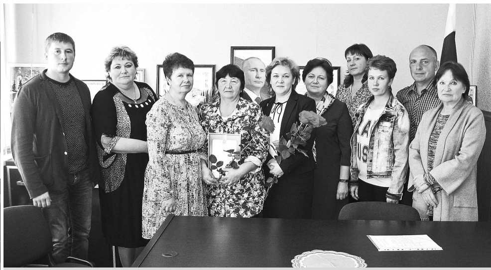
Совет народных депутатов муниципального образования Павловское.