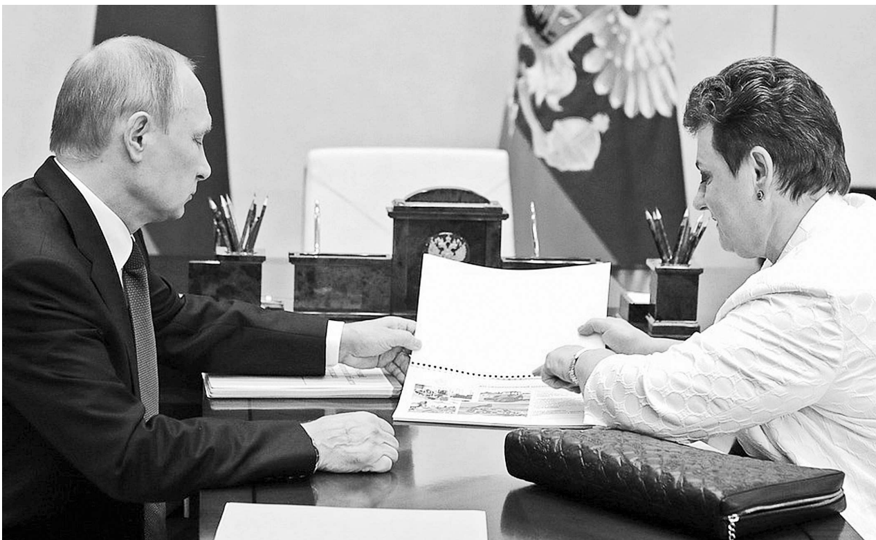
Рабочая встреча Президента России Владимира Путина с Губернатором Владимирской области Светланой Орловой.

Бронирование по тел. 8-920-922-40-69 или на сайте www.svbani.ru