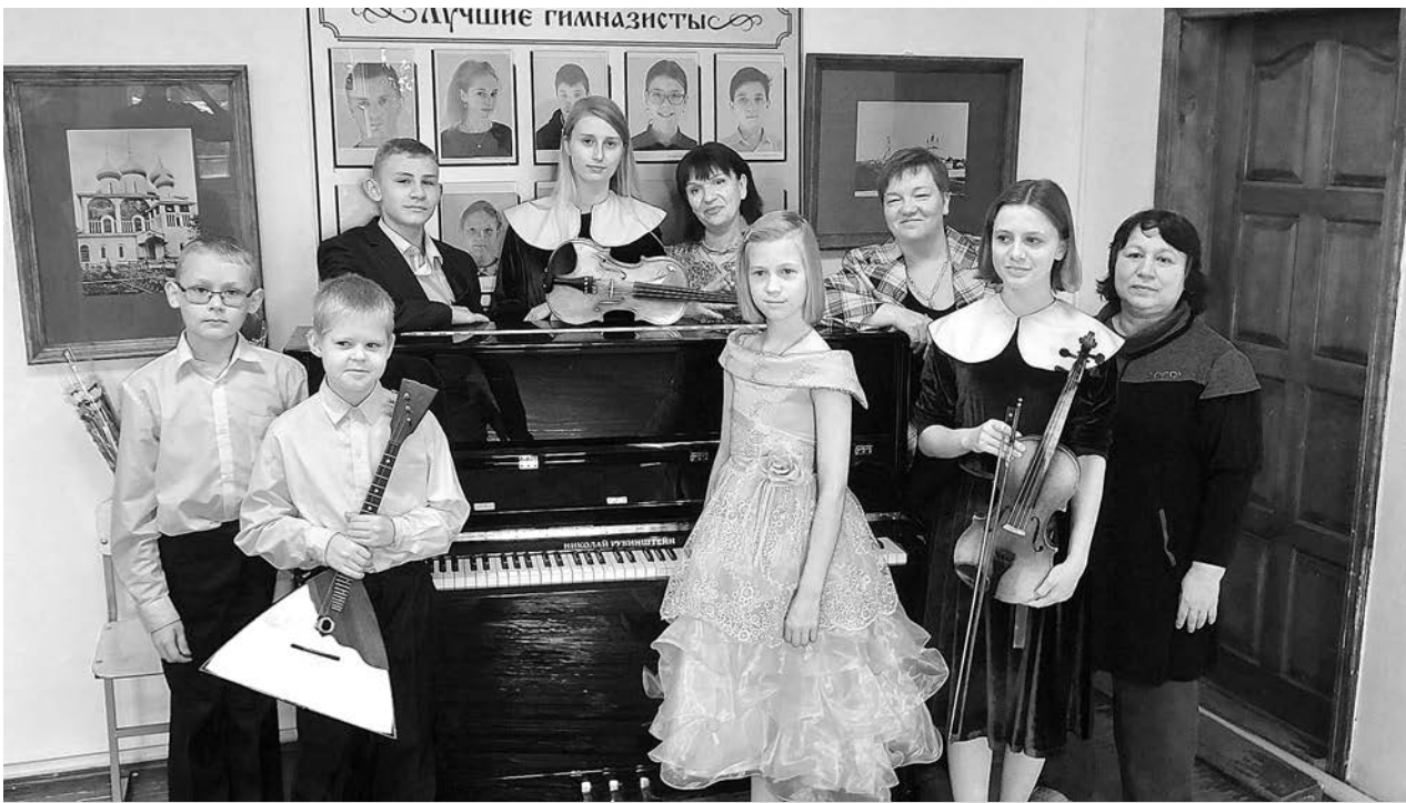
Фортепиано в детской школе искусств им. В.А. Ширшиковой в пос. Садовый.