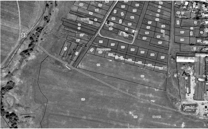
Схема границ территории проектирования.

Приложение №2 к постановлению администрации Суздальского района от 11.09.2018 года № 2192