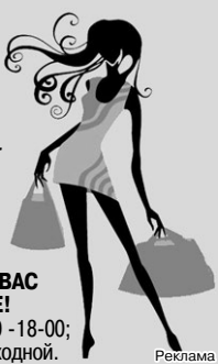
График работы: пон.-пят.: 9-00 - 18-00; суб.: 9-00 - 15-00; воск. - выходной.

ВСЕГДА РАДЫ ВИДЕТЬ ВАС В НАШЕМ МАГАЗИНЕ!