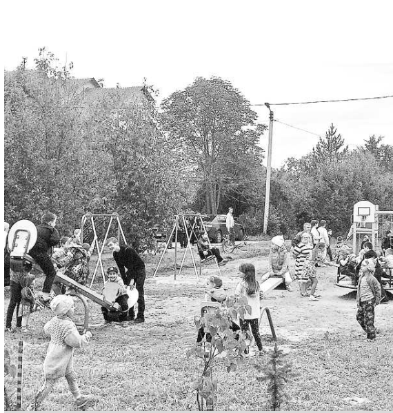
Новая детская площадка.