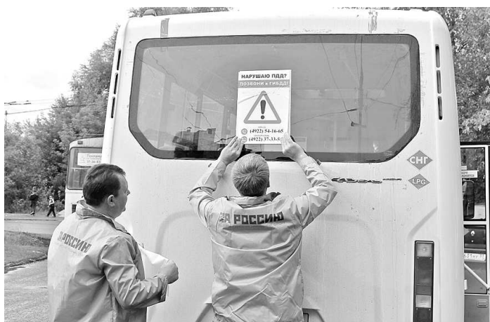
Активисты ОНФ наклеивали специальные стикеры на автобусы.

«На прошлой неделе во Владимире, следуя на своем автомобиле за автобусом одного из городских маршрутов, я заметил, что только на небольшом участке от улицы Гагарина до рынка «Цен-