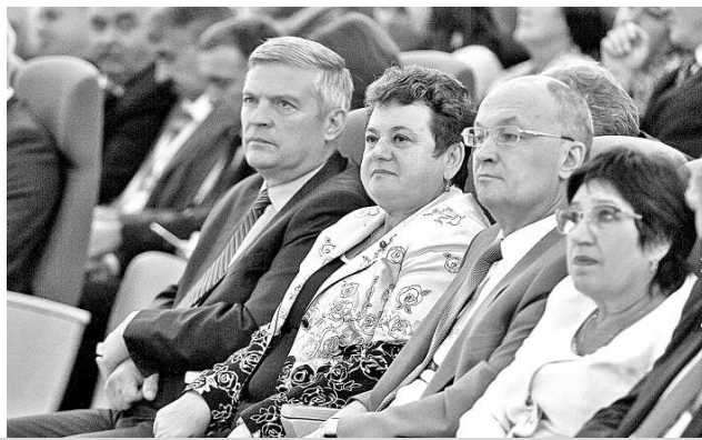
День сельского старосты-2016.