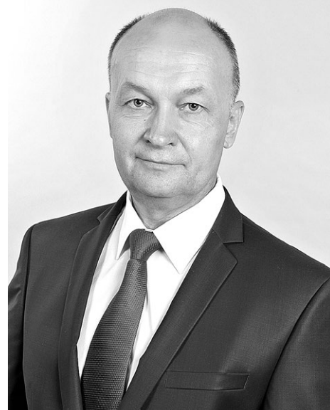
Председатель ЗС Владимирской области Владимир Киселёв.