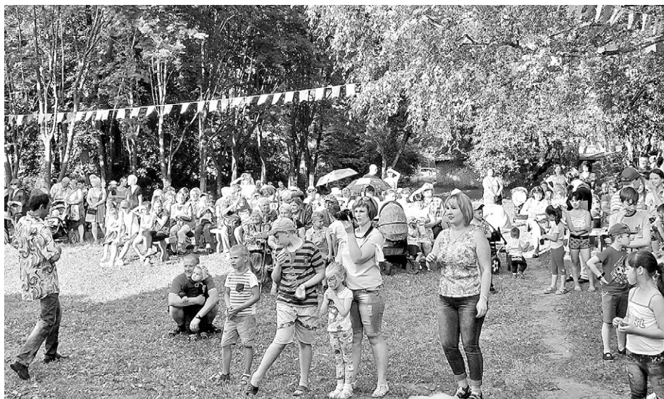
На празднике в Павловском было весело и интересно и взрослым, и детям.