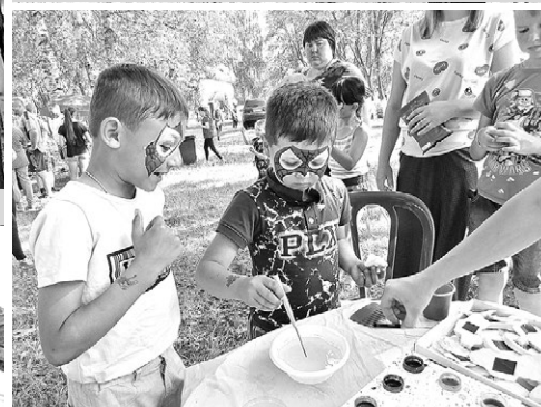
На занятиях по аквагиму.