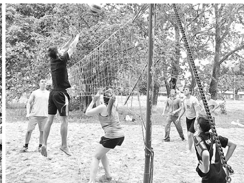
Игра в волейбол.