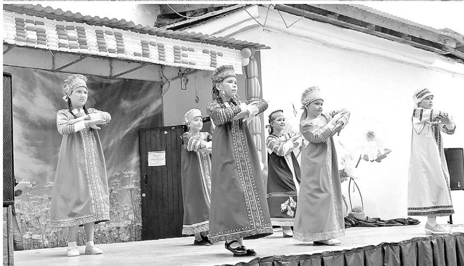
В центре народных гуляний были выступления местных артистов и самодеятельных коллективов.