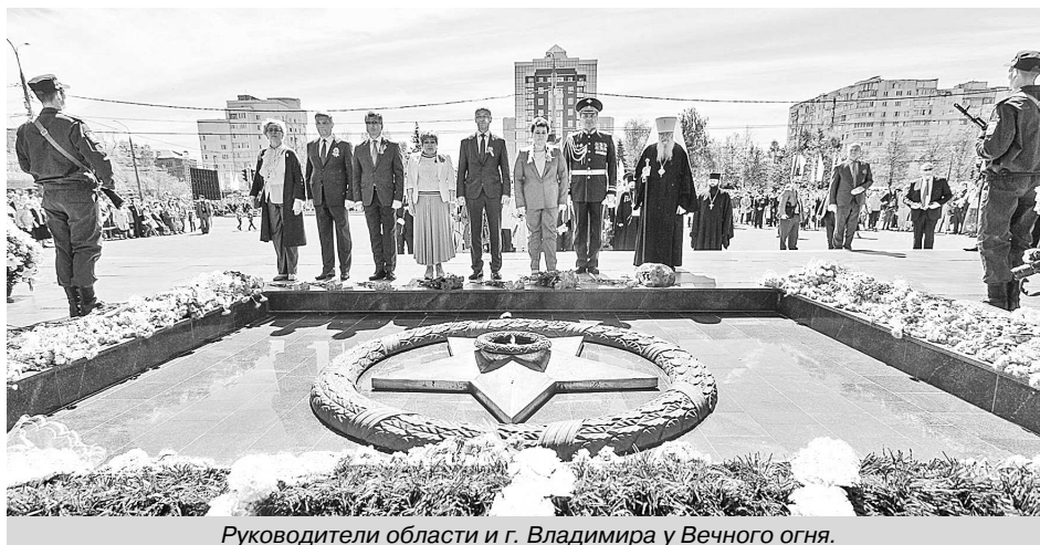
Руководители области и г. Владимира у Вечного огня.