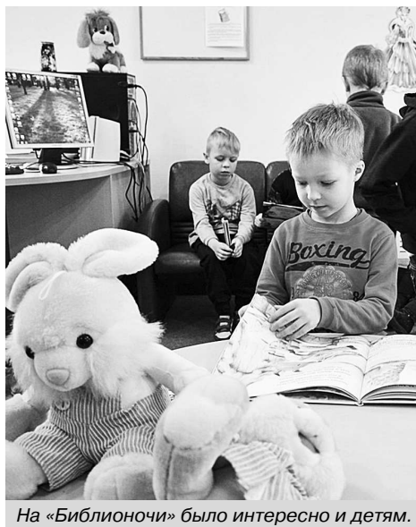
На «Библионочи» было интересно и детям.