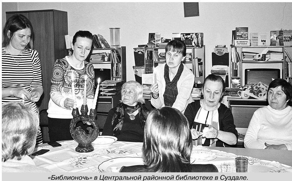
«Библионочь» в Центральной районной библиотеке в Суздаль.

К слову, за все послевоенные годы лишь одна публикация была в местной газете «Сельская новь» на эту тему – в нескольких номерах в августе 1971 года публиковалась статья Дёмина о том, что Суздаль