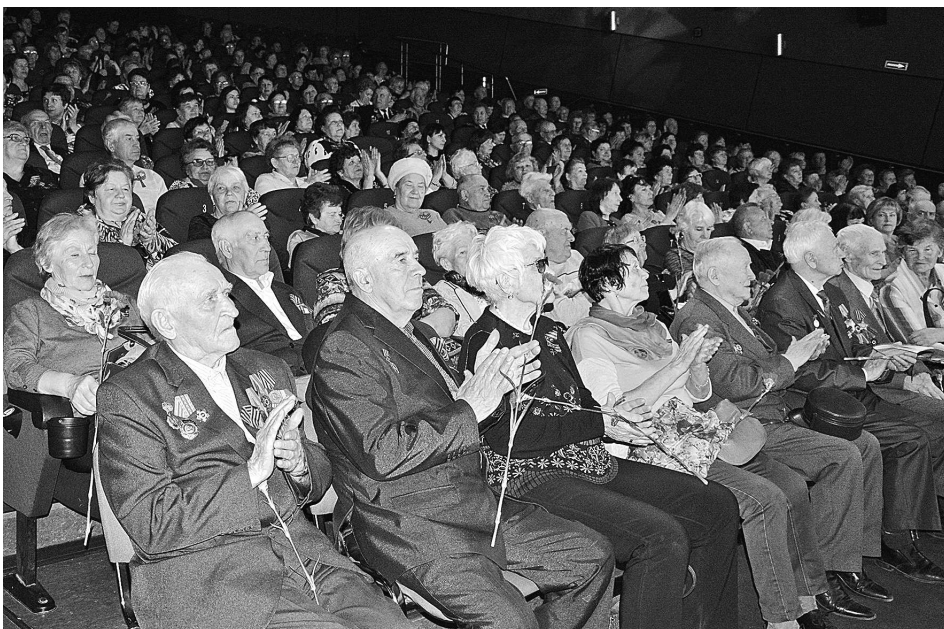
На празднике, посвященном Дню Победы, собрались более 250 ветеранов, тружеников тыла и детей войны нашего региона.