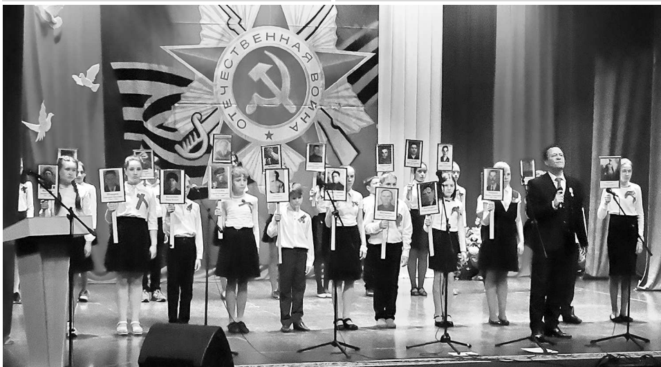
На сцене «Бессмертный полк».