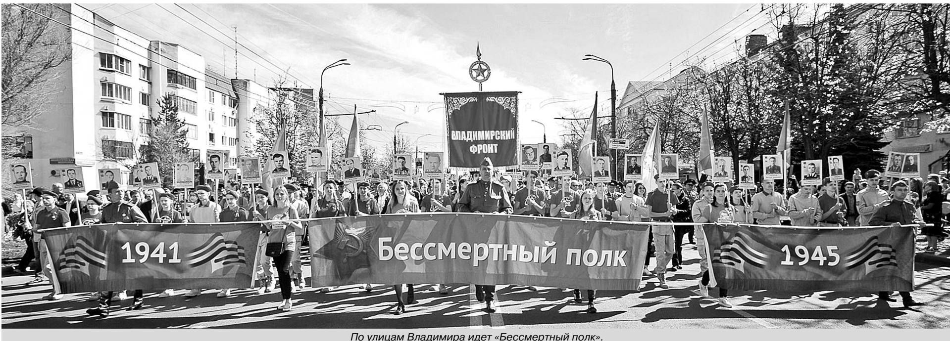
По улицам Владимира идет «Бессмертный полк».