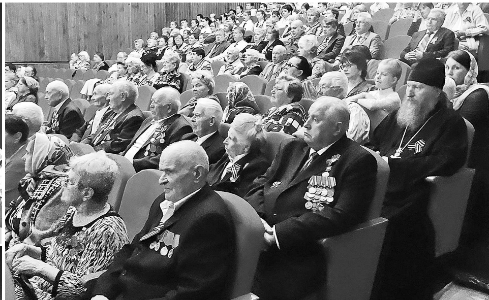
На торжественном мероприятии в с. Новое.