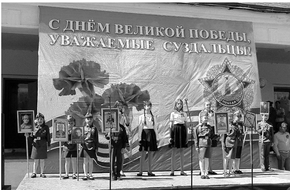
Вспомним всех поимённо.