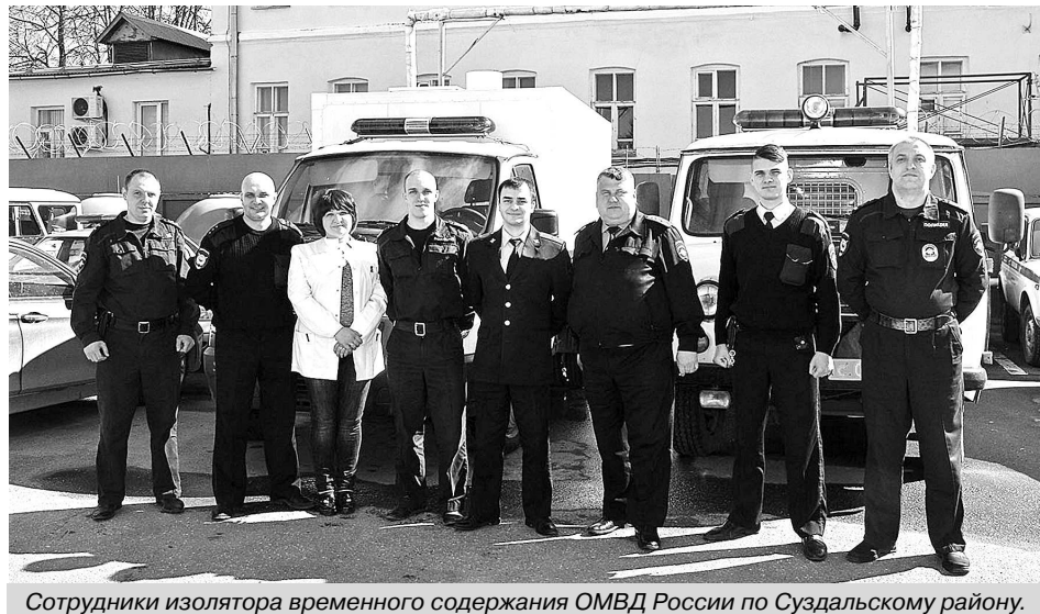
Сотрудники изолятора временного содержания ОМВД России по Суздальскому району.

В Суздале нет столовых, поэтому питание контингент изолятора получает из кафе (заведения, которое выиграет