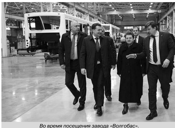
Во время посещения завода «Волгабас».

«Сегодня импортозамещение и экспортоориентированность превращаются в цифровую экономику.