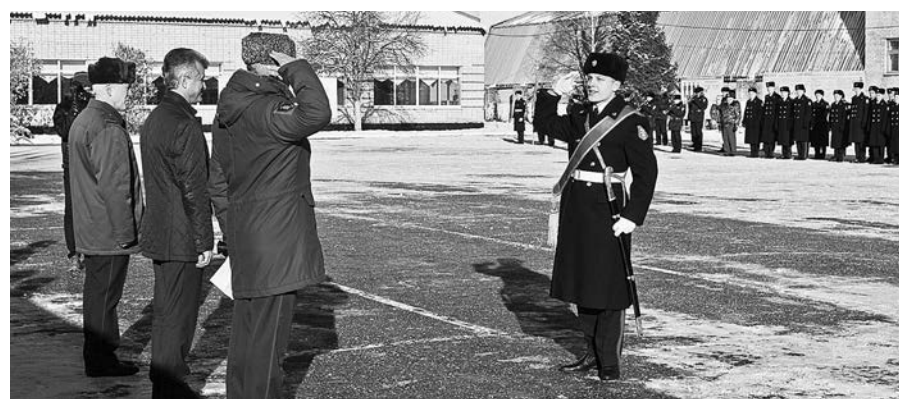
Воспитанники областного Кадетского корпуса принимают присягу.

Этими программами финансировалось строительство 31 км межпоселковых и 75 км распределительных газовых сетей. Столь масштабное одновременное подключение к газоснабжению сразу 9 населённых пунктов произошло в 33-м регионе впервые.