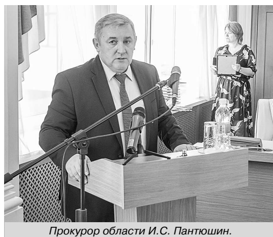
Прокурор области И.С. Пантюшин.

В.В. ТУРКОВА , старший помощник прокурора области по взаимодействию со средствами массовой информации и общественностью.