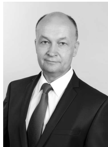
Председатель ЗС области Владимир Киселёв.

региона полностью поддержала введение так называемых «земельных каникул». Принятый сегодня депутатами закон, предусматривает для собственников зданий и сооружений, расположенных на участке, снижение ставки со 100% до 50% от кадастровой стоимости арендуемого участка, а для граждан - с 60% до 25%. Владимир Киселёв отметил, что данная мера не только поможет жителям, но и положительно скажется на наполняемости местных бюджетов, поскольку доходы от продажи земельных участков пойдут в казну муниципалитетов. Пока снижение ставки рассчитано на срок до 1 января 2022 года.