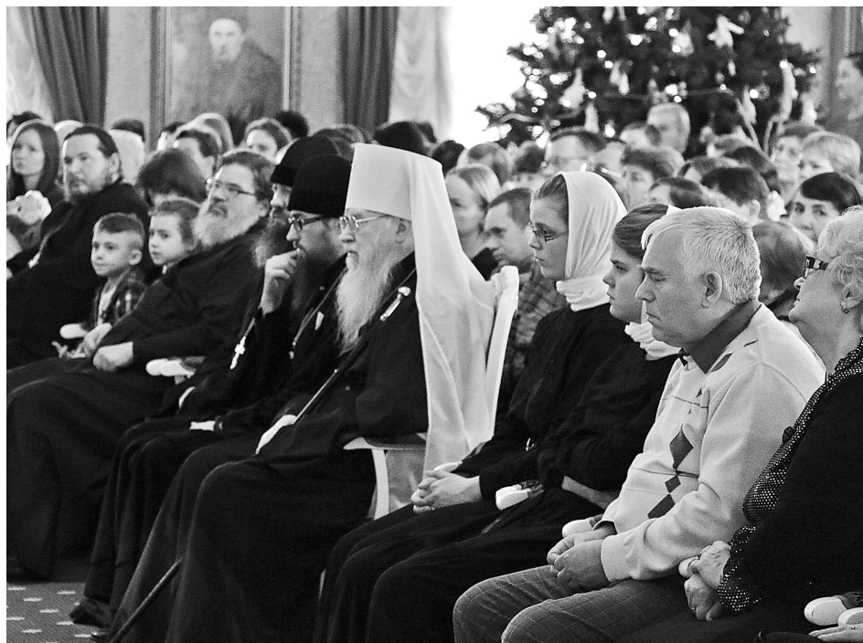
Зрители, почетные гости, участники Рождественского концерта.