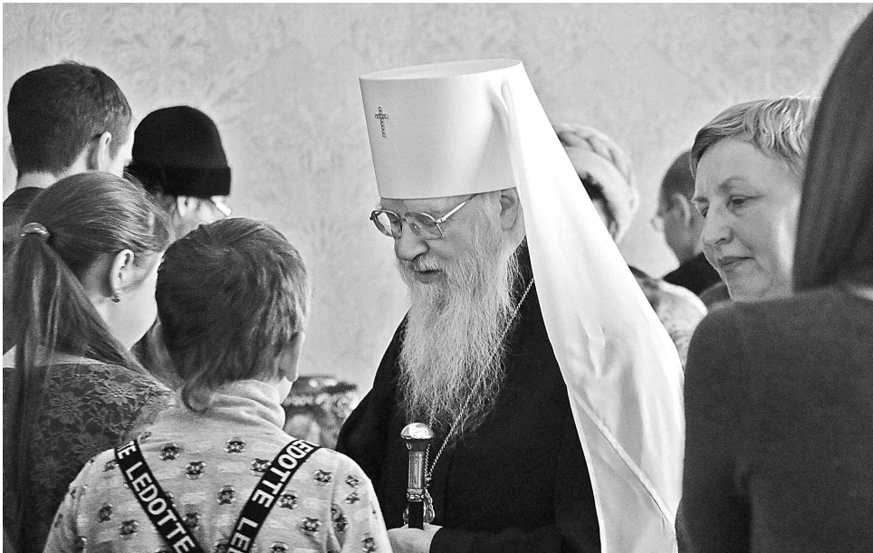
Благословение владыки Евлогия.