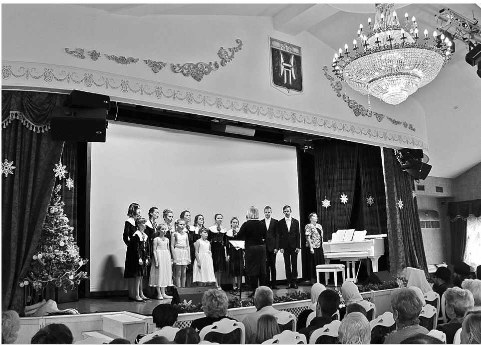
Выступают учащиеся Суздальской православной гимназии.