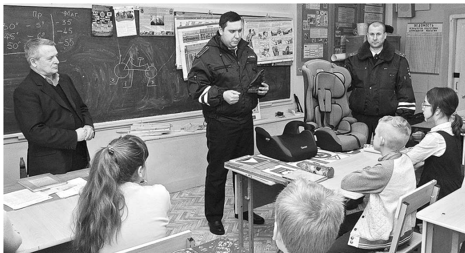
Беседу со школьниками проводят сотрудники ОГИБДД ОМВД России по Суздальскому району.