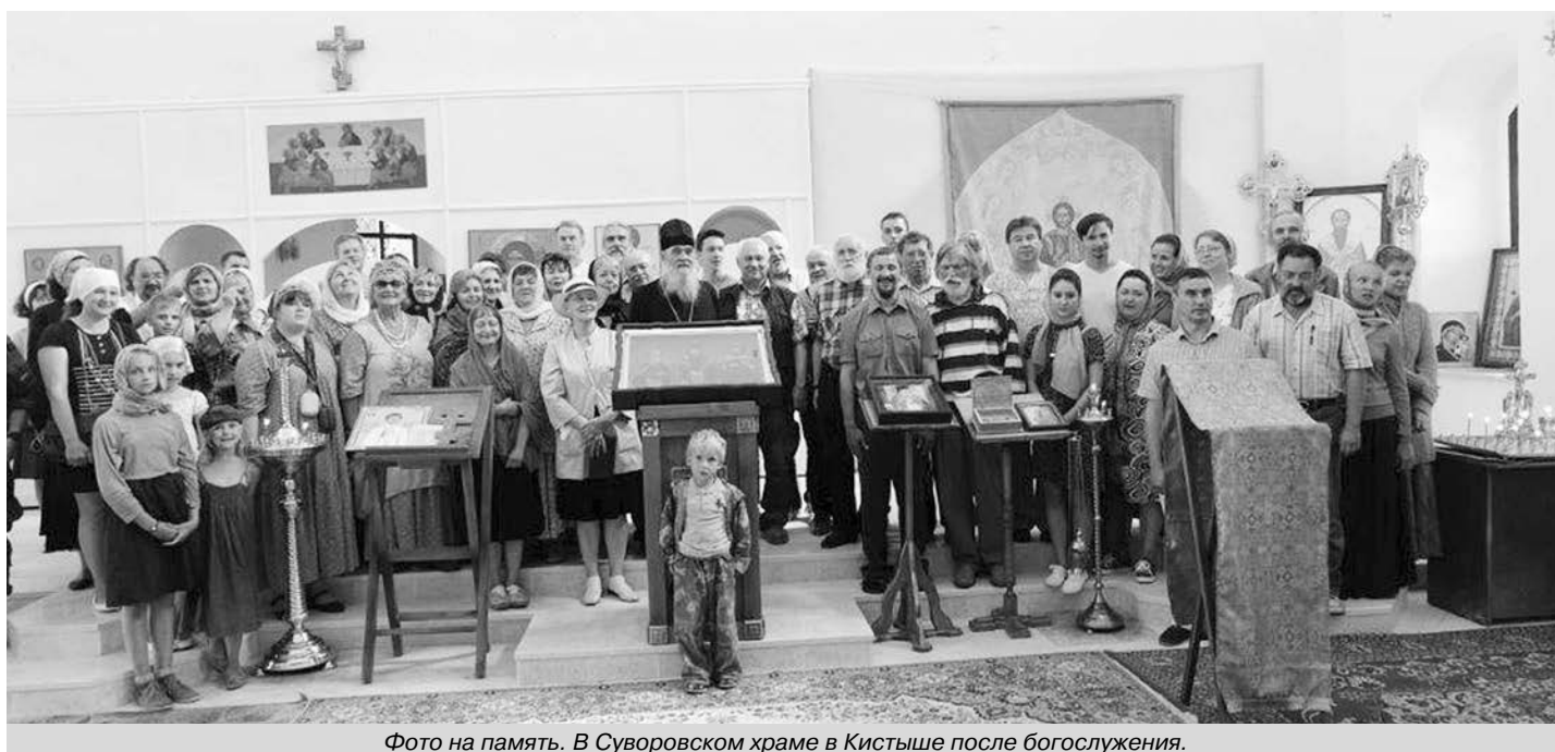
Фото на память. В Суворовском храме в Кистыше после богослужения.

О перечислении просим, по возможности, сообщать на e-mail: cherkasov.rus@gmail.com , или на сайт: http://www.omofor.ru