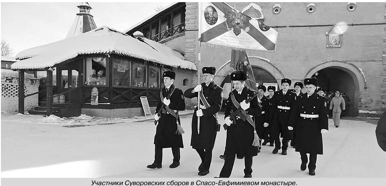
Участники Суворовских сборов в Спасо-Евфимиевом монастыре.