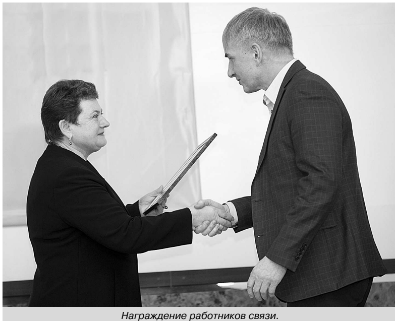
Награждение работников связи.

В 2017 году на территории области завершено строительство 24 радиотелевизионных башен. Теперь первый цифровой пакет из 10-ти общероссийских телеканалов доступен 99 процентам жителей региона. Немаловажно при этом, что в конце прошлого года в составе первого цифрового пакета началась трансляция областных программ – это новостные и тематические передачи ГТРК «Владимир». В пакетах телеканалов кабельного телевидения транслируется региональный