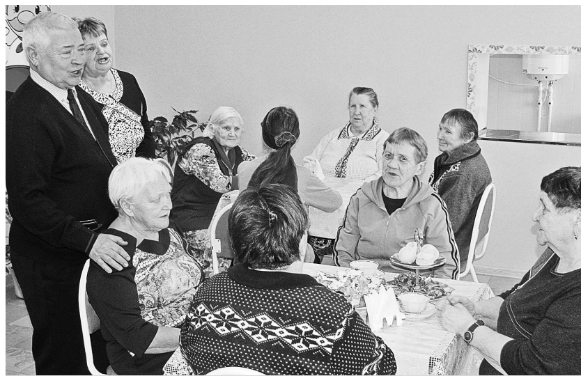
В отремонтированной столовой в отделении Торчино.