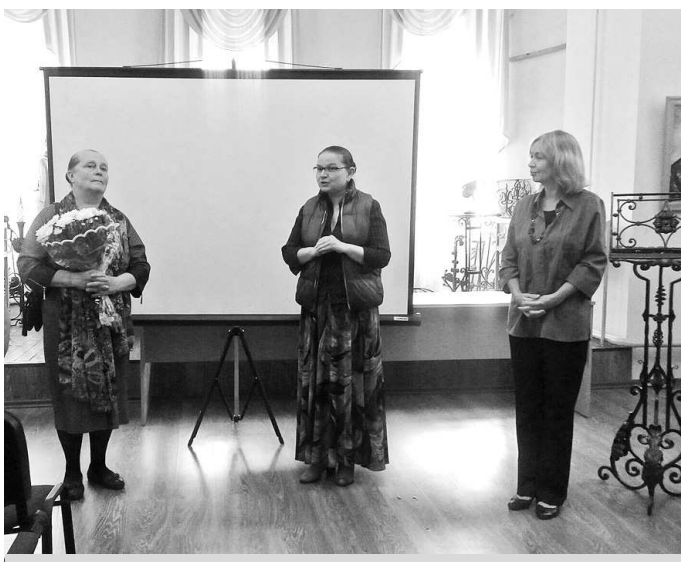
На открытии выставки.

Выставка замечательна ещё одной чертой – написанием детских портретов. Особенно подкупает своей непосредственностью работа «Первоклассница». Эта работа содержит в себе глубину и радость детской непосредственности. От общения с детством художница получает творческое удовольствие.