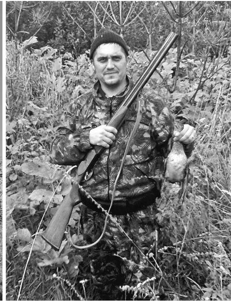
Любимый вид отдыха – охота.