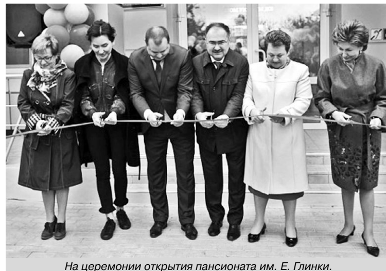
На церемонии открытия пансионата им. Е. Глинки.