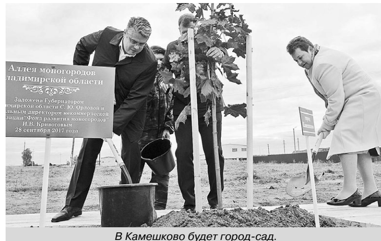
В Камешково будет город-сад.

Кстати, чуть раньше в Камешкове закончили строительство кольцевой дороги, по которой можно будет подъехать к площадкам предприятий-резидентов