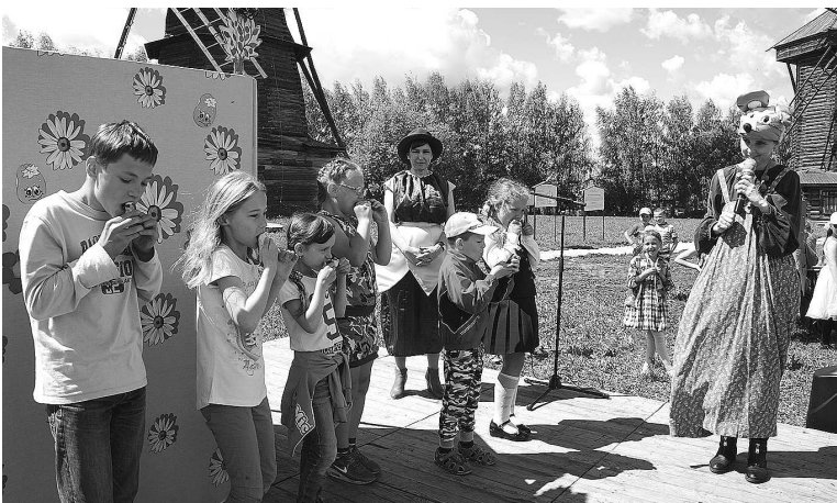
Конкурс «Загрызи огурчик».