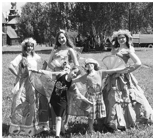
Участницы театра моды «Созвездие».