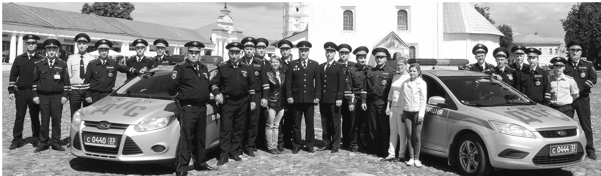
Коллектив отделения ГИБДД.