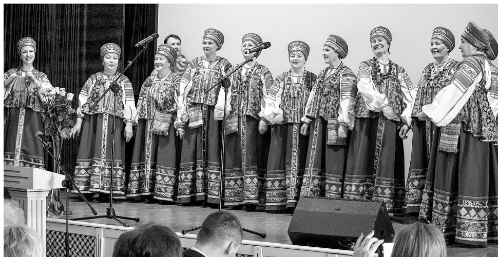
Народный хор «Традиция».