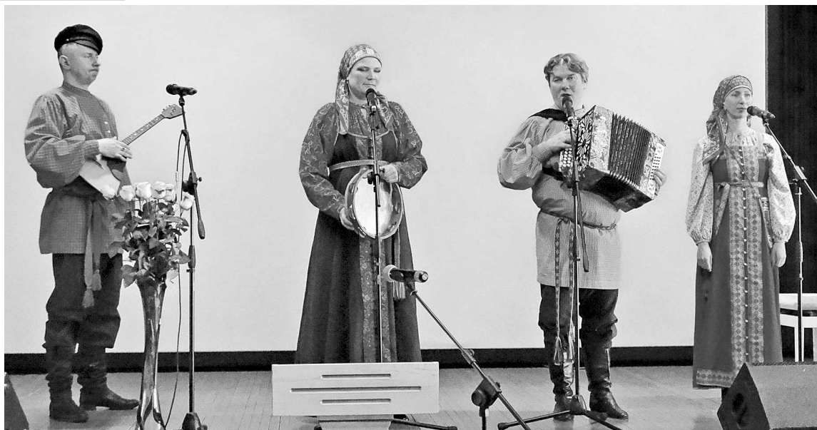
Выступает ансамбль «Радунца».