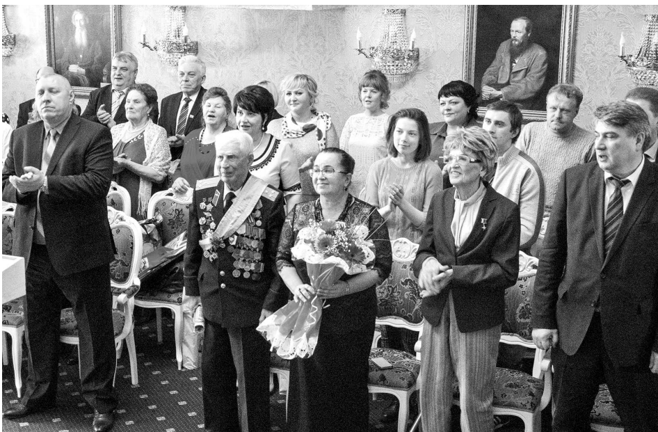
Звучит гимн Суздальского района.