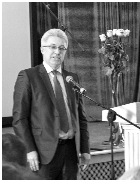
Слова приветствия от В. Ю. Картухина, зам. председателя ЗС области.