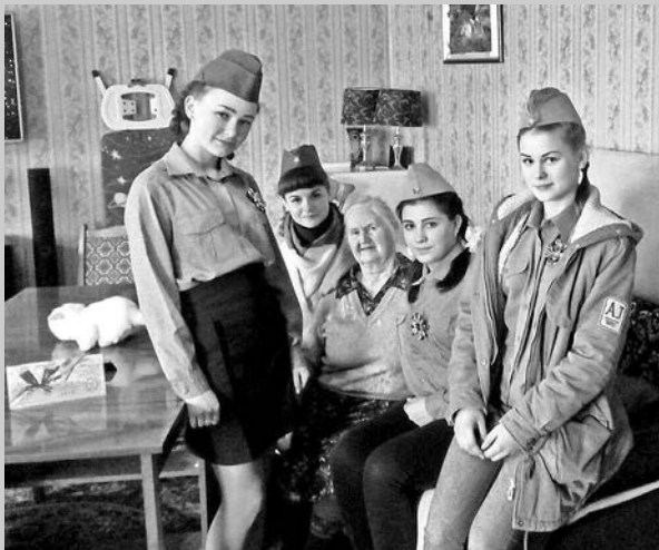
Акция «День Победы нас объединяет!»