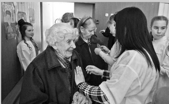
Акция «Больше чем слово».