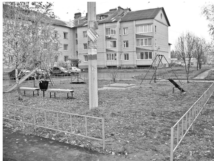
Благоустроенный двор на бульваре Всполье.

Кроме этого, нас подвели поставщики малых архитектурных форм. Скамейки, урны,