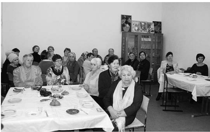
В «Михайловской светелке».