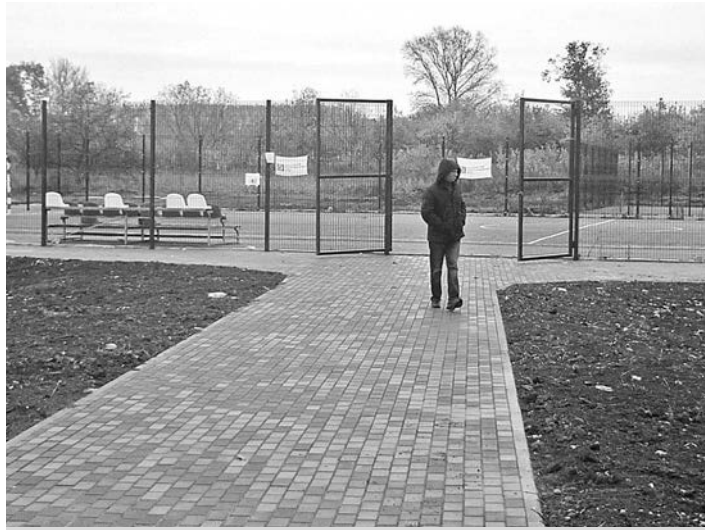
Спортивная зона в парке 950-летия Суздаля.

общественная территория. Жители города ее выбирали сами. Было организовано открытое голосование на официальном сайте города Суздаля и в официальной группе социальной сети ВКонтакте. Большинство горожан проголосовали за благоустройство спортивной зоны парка 950-летия Суздаля.