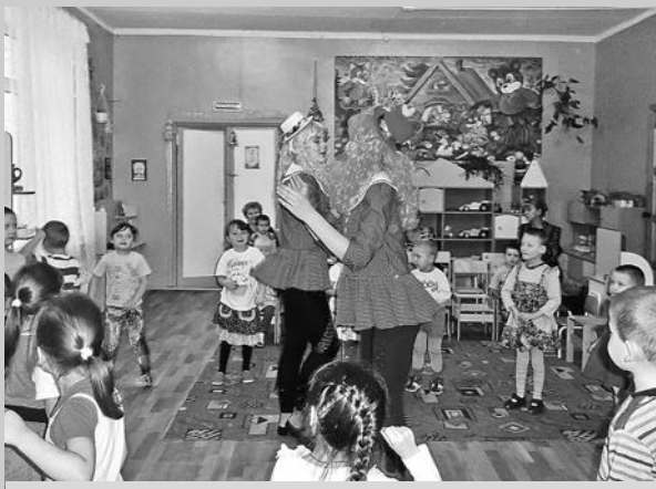
Акция «Радость на всех» с.Цибеево.