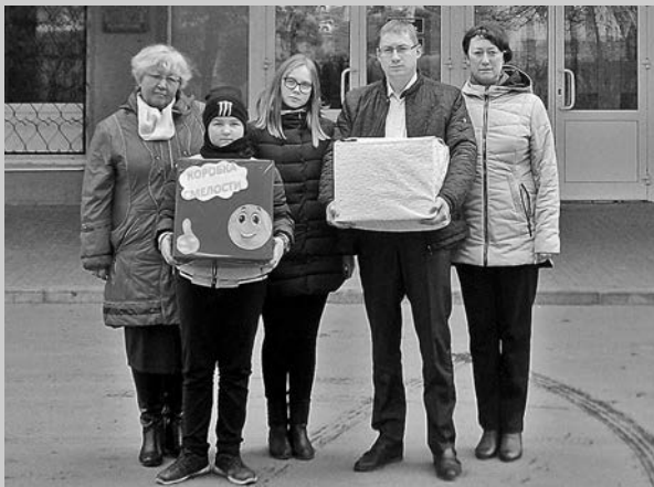
Акция «Коробка смелости».