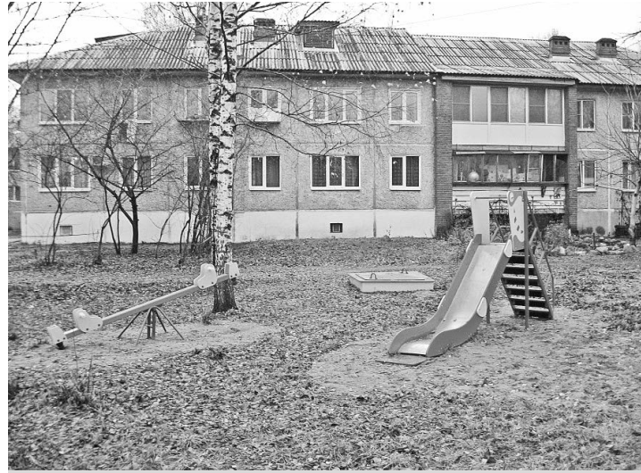
Новая детская площадка на ул. Советская.

ограждения, оборудование детских площадок пришлось устанавливать в первых числах ноября.